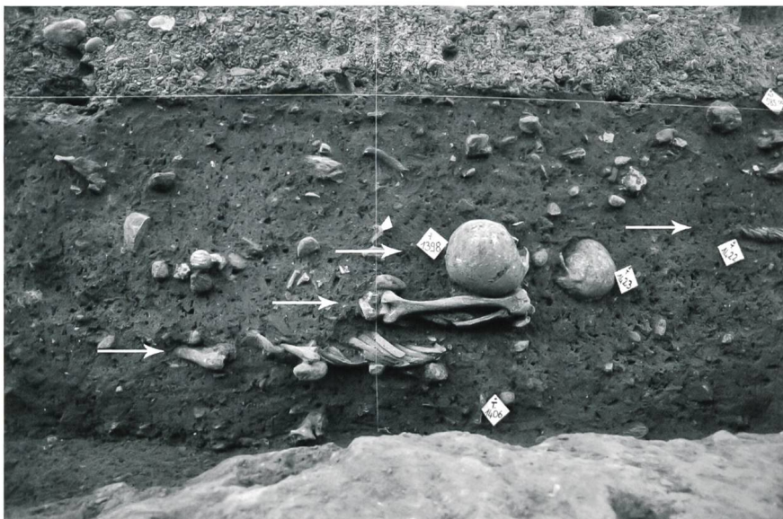
Fig. 3 Les quatre niveaux d'inhumation visibles dans le profil est de la tranchée

de sépultures partiellement arasées, situées directement sous le tout-venant moderne 5 . Diverses tranchées (eau, électricité, télécommunications, etc.) avaient en outre perturbé une trentaine d'autres tombes. Malgré tout, les fouilles archéologiques ont permis de mettre au jour près de 170 individus, dont 146 adultes et 22 enfants 6 , inhumés à des profondeurs