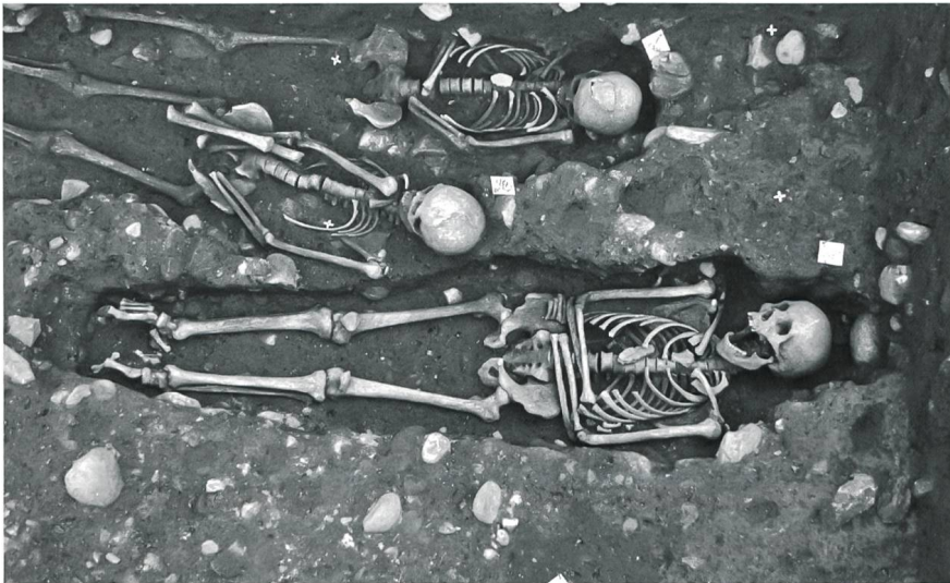
Fig. 4 Fosse anthropomorphe de la tombe 1389