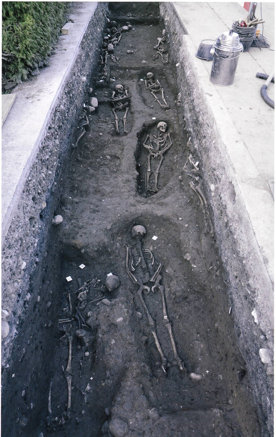
Fig. 1 Vue générale de la tranchée fouillée en 2011

Parmi les principaux enjeux des recherches archéologiques à Belfaux – la mission première consiste bien entendu en une fouille préventive –, l'évolution de l'habitat et le développement du cimetière ainsi que les relations étroites que ce dernier a manifestement entretenues avec l'église dès l'origine figurent au premier plan. L'ensemble devrait en effet nous permettre de déterminer chronologiquement la véritable naissance du