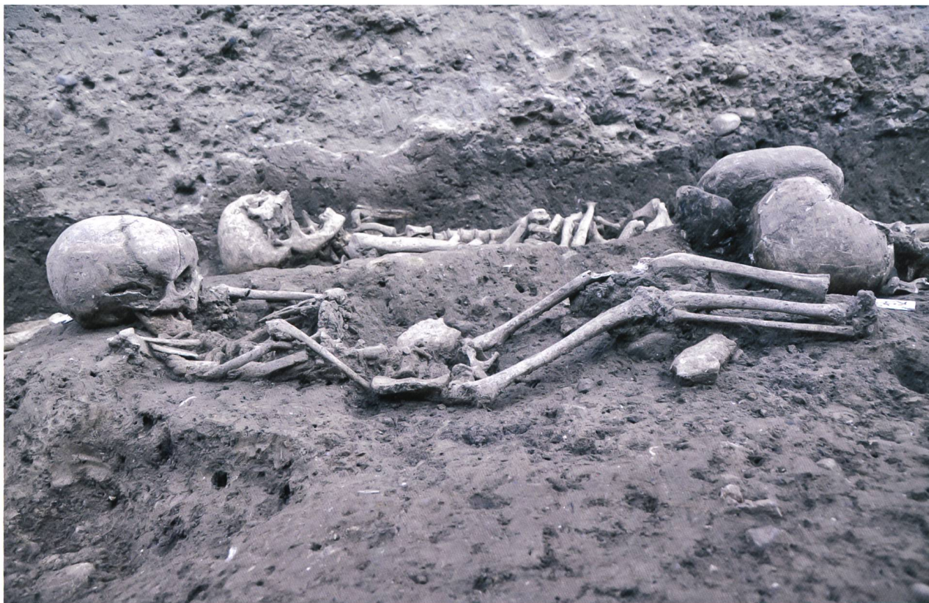
Fig. 6 Tombe 1396, enfant inhumé tête et genoux surélevés

jour à l'ouest de la tranchée permettent néanmoins de les interpréter comme les vestiges de petites constructions à poteaux en bois ou éventuellement de palissades. Un bâtiment à parois en pisé, découvert précédemment et daté du XIV e siècle au plus tard 12 , témoigne de la persistance du village médiéval à proximité du cimetière. Toutefois, une analyse radiocarbone effectuée sur un charbon prélevé dans l'un des trous de poteau fouillés en 2011 a livré une datation beaucoup plus ancienne, entre le VIII e et le IX e siècle 13 . Ce résultat démontre que l'habitat du Haut Moyen Age s'étendait au-delà des fonds de cabane précédemment mis au jour au nord-ouest de la nécropole (voir fig. 2), et que les multiples structures en creux observées en bordure sud et sud-ouest de cet espace funéraire doivent appartenir à plusieurs phases d'occupation qui s'étendent entre le VIII e et le XIV e siècle. Nous nous trouvons ainsi en présence d'une occupation continue sur près de mille ans à partir de la première construction de l'église au VI e siècle.