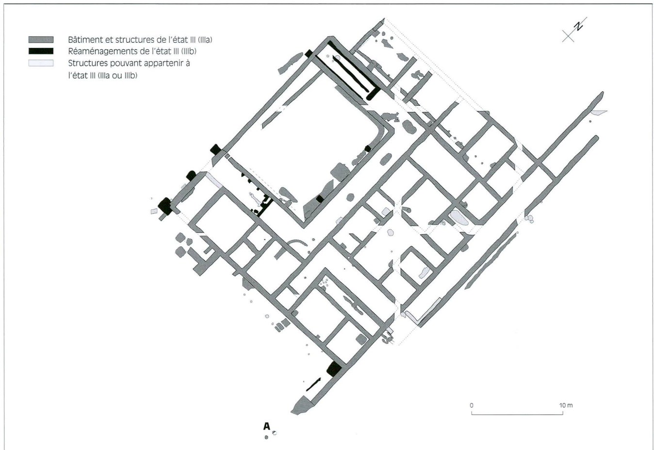
Fig. 4 Etat III (fin du I er -III e siècle après J.-C.)