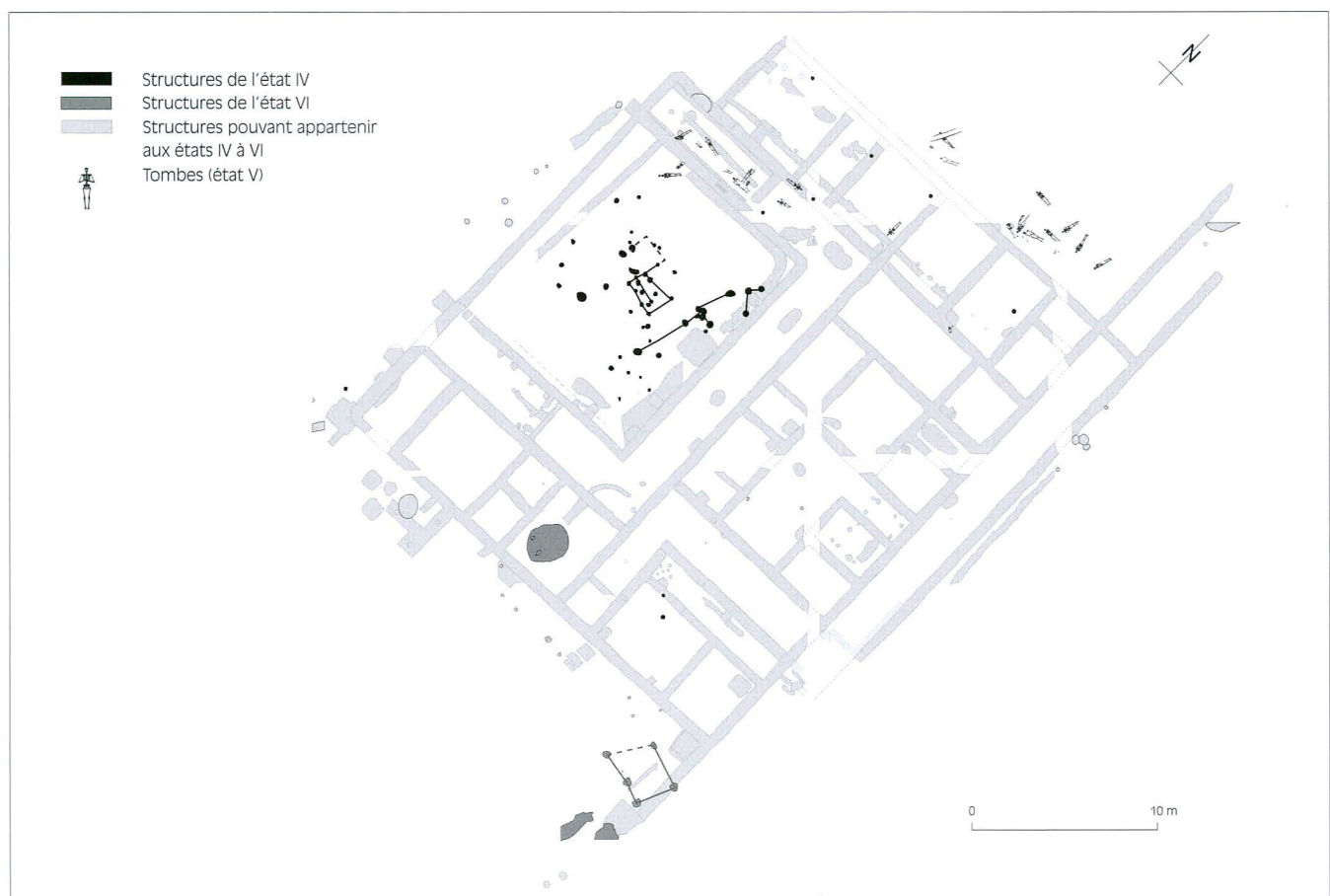
Fig. 5 Etats IV à VI (Bas-Empire - XIII e siècle après J.-C.)