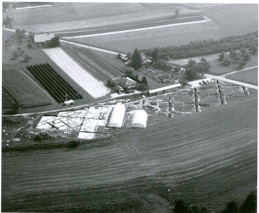
Fig. 1 Vue générale du site en cours de fouille

Au milieu du I er siècle après J.-C., le chenal sud est entièrement comblé, dans sa partie ouest et un premier établissement