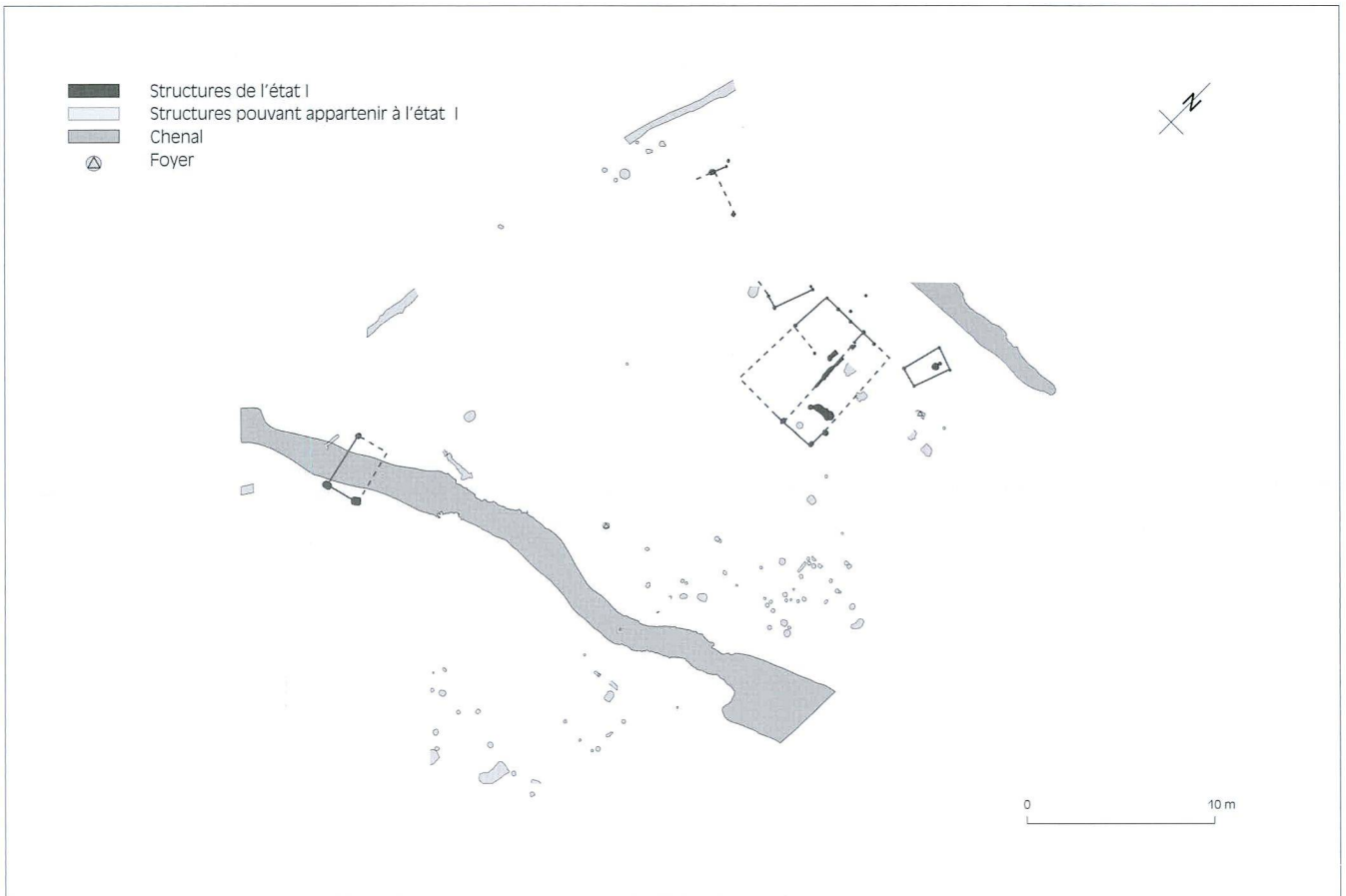
Fig. 2 Etat I (1 re moitié du 1 er siècle après J.-C.)