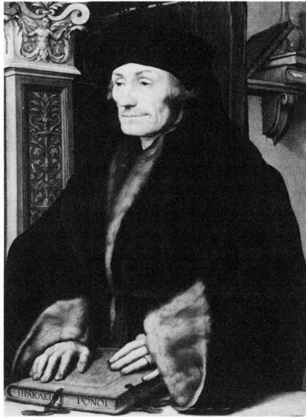
Abb. 5. Erasmus. Bildnis von Hans Holbein d.J., 1523. London, National Gallery.

ner sonstigen, hellen und klaren Linienzeichnung zeigen diese Illustrationen tonige Wirkungen, malerische Effekte, wie sie Holbein zuweilen im Wettstreit mit den romantisch gestimmten deutschen Zeitgenossen wie sie und oft noch vollkommener als sie angewandt hatte. Sie gehören zum Schönsten, was Holbein auf dem Gebiete der religiösen Kunst erdacht hat.