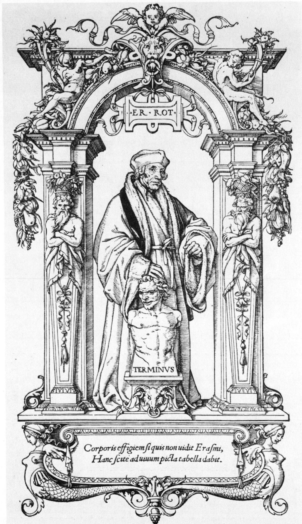
Abb. 11. Hans Holbein d.J., Erasmus «in eim ghüs». Holzschnitt, 1538/40.