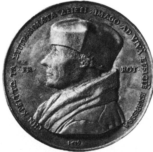
Abb. 3. Erasmus-Medaille des Quinten Massys, 1519. Avers. Historisches Museum Basel.