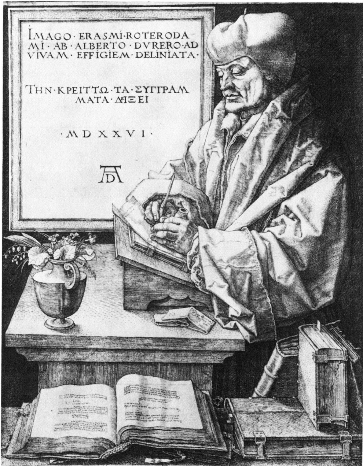
Abb. 8. Albrecht Dürer, Erasmus. Kupferstich, 1526.