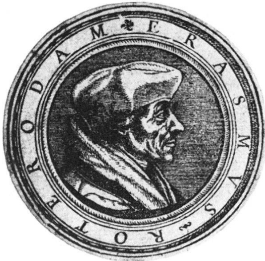
Abb. 9. Hans Holbein d.J., Erasmus im Rund. Holzschnitt, 1532.

die späten Holzschnitte, von denen soeben noch die Rede sein soll 37 .