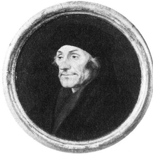
Abb. 10. Hans Holbein d.J., Erasmus im Rund, 1529/32. Basel, Öffentliche Kunstsammlung.