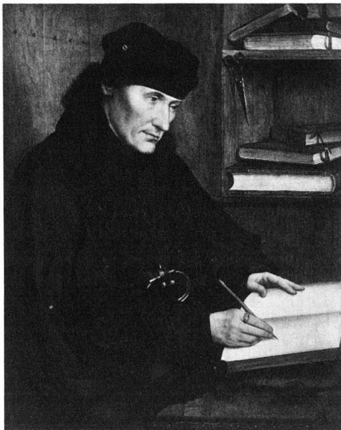
Abb. 4. Erasmus. Bildnis von Quinten Massys. 1517. Rom, Galerie Corsini.

Wichtigere zeigen seine Schriften. Die Medaille hatte ihm ziemliche Kosten, mehr als 30 Gulden , wie zuvor auch das Gemälde, verursacht 14 . Aber er hatte nun etwas, das er Bekannten schenken konnte. 1524 erkundigte er sich noch beim befreundeten Humanisten Willibald Pirckheimer in Nürnberg nach der Möglichkeit eines Nachgusses 15 .