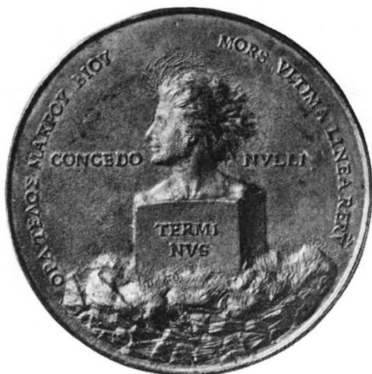
Abb. 2. Erasmus-Medaille des Quinten Massys, 1519. Revers mit Terminus. Historisches Museum Basel.

sternische sitzt. Erasmus trägt die Kappe des Geistlichen, aber alles übrige entspricht nicht den Tatsachen. Erasmus arbeitete nie im Sitzen, sondern stehend, wie er gelegentlich selbst bezeugt: durch die schon fünfundzwanzigjährige Gewohnheit beim Schreiben zu stehen schmerzte ihn das linke Bein 10 . Vor allem aber erscheint er viel zu jung, was Erasmus, wie Myconius über dem Bildchen vermerkt, beim Betrachten zum Ausruf veranlasste: Oho, oho, wenn Erasmus noch so aussähe, würde er sogleich heiraten 11 .