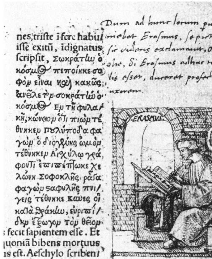
Abb. 1. Randzeichnung im Exemplar des «Lobes der Torheit» aus dem Besitz des Oswald Myconius, 1515/16. Kupferstichkabinett Basel.

durch den berühmten Maler Quinten Massys als Geschenk für Thomas Morus darstellen zu lassen. Und abermals vergingen sechs Jahre, bis ihn in Basel Holbein zu malen bekam. Wiederum sechs Jahre später, offenbar zum Abschied von Basel, schuf Holbein ein Bildnis, um dessen Varianten und Kopien sich die Gebildeten stritten, und auf deren Rahmen noch heute die Museen gerne den Namen Holbeins heften. 1532 wünschte sich Hieronymus Froben eine neue Zeichnung Holbeins für den Holzschnitt, ja sogar noch 1538, zwei Jahre nach des Erasmus Tode, eine besonders prächtige Darstellung für die Ausgabe der Gesamten Werke.