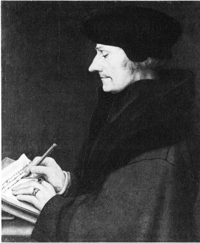
Abb. 6. Der schreibende Erasmus. Bildnis von Hans Holbein d.J., 1523. Basel, Öffentliche Kunstsammlung.