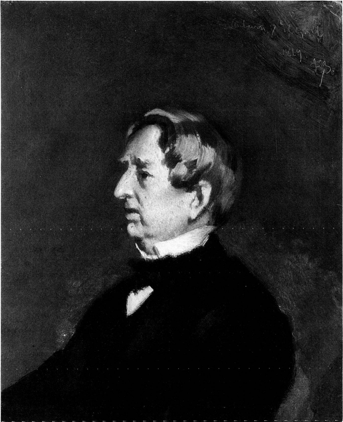
William Henry Seward, Staatssekretär Ölskizze, Kupferstichkabinett Basel