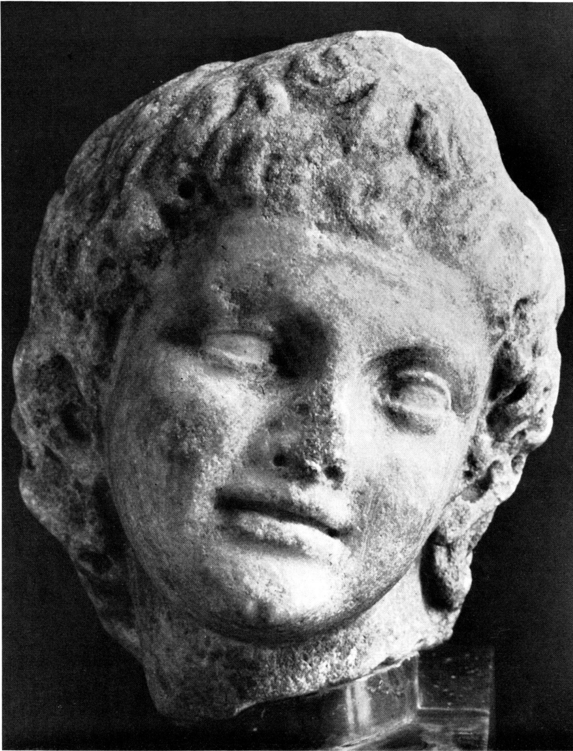
Taf. 36. Knabenkopf aus einer Gruppe. H. 20 cm.