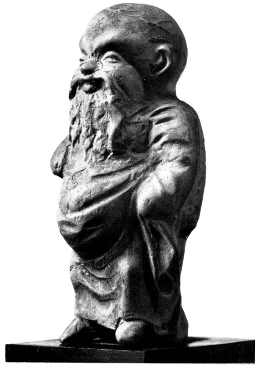
Taf. 40b. Tonstatuette eines Silens. H. 13,5 cm.