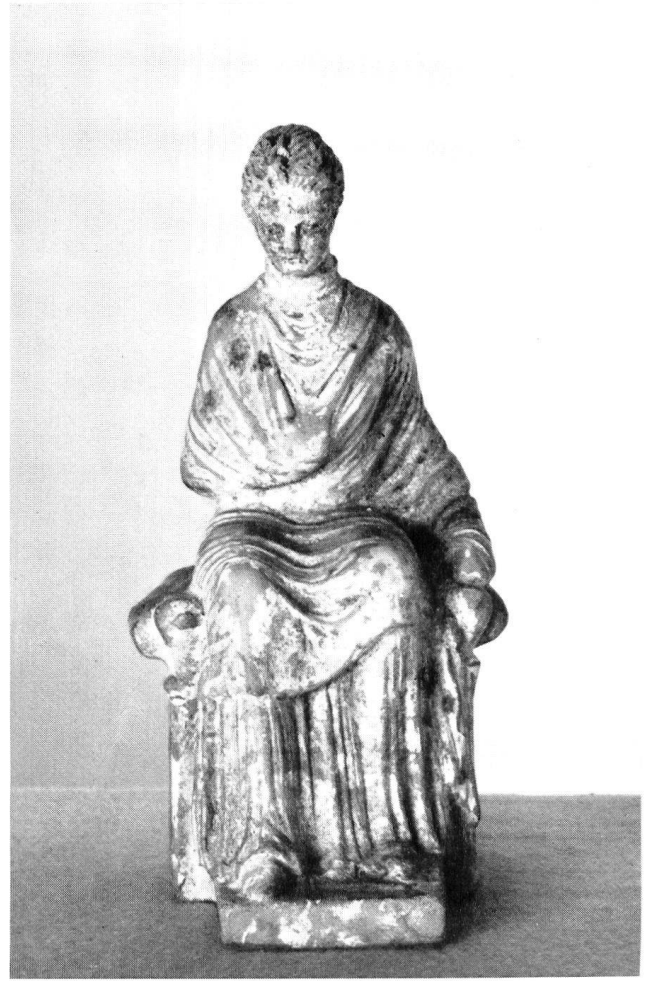
Taf. 34 b. Tonstatuette eines sitzenden Mädchens. H. 13 cm.