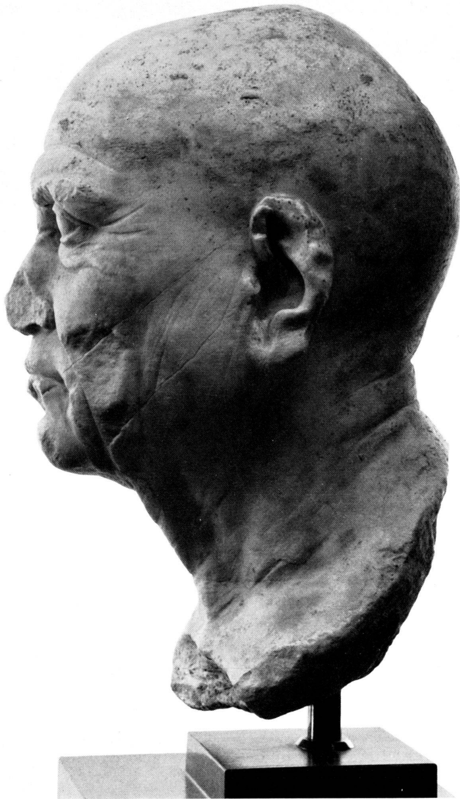
Taf. 38. Bildnisbüste eines Römers. H. 37,5 cm.