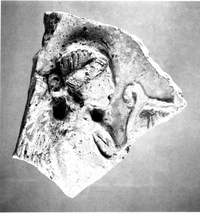
Taf. 40a. Tonrelief einer geflügelten Leierspielerin. H. 11,5 cm.