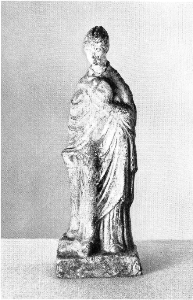
Taf. 35 a. Tonstatuette eines an eine Grabsäule gelebnten Mädchens. H. 17 cm.