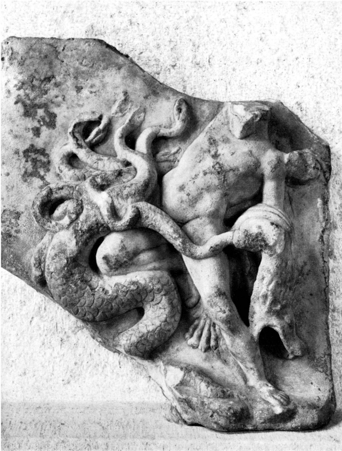
Taf. 37. Relief des Herakles im Hydrakampf. H. 27,7 cm.