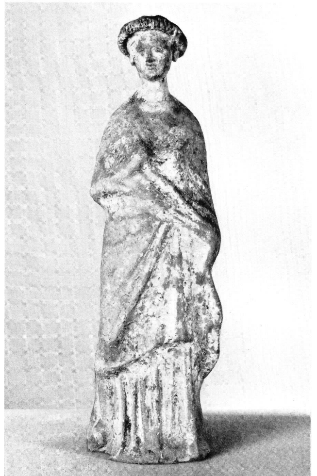
Taf. 35 b. Tonstatuette eines bekränzten Mädchens. H. 26 cm.