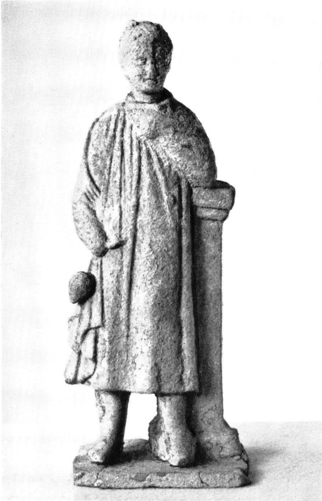
Taf. 34 a. Tonstatuette eines Jünglings an Pfeiler. H. 18 cm.