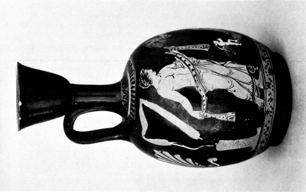
Taf. 33. Apulische bauchige Lekythos. H. 21,5 cm.