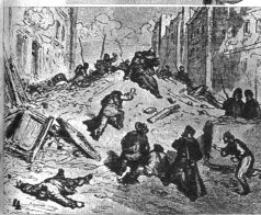
4 Die Franzosen glaubten die Errungenschaften der Revolution als gesichert, aber die Klassengegensätze wirkten sich bis zum Juni in einem furchtlichen Bürgerkrieg aus und Paris sah eine Strassenschlacht wie auch nie, in der auch der Erzbischof von Paris fiel. Die Revolution siegte.

Als die Volkvertreter im Dezember 1848 dann den Beschluss fassten, einen Präsidenten der Nationalversammlung auf vier Jahre zu wählen, kamen nur zwei Bewerber in Betracht: Cavaignac und Napoleon. Eine geschickte Propaganda verhalf Napoleon in den Sattel. Kurze Zeit später hatte dann Frankreich durch einen Staatsstreich wieder einen Monarchen: Napoleon III.