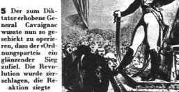
5 Der zum Diktator erhobene General Cavaignac wusste nun so geschickt zu operieren, dass der Ordnungspartei ein glanzvoller Sieg zufiel. Die Revolution wurde zer schlagen, die Reaktion siegte.

Die Juntschicht in Paris, die eine unüberbrückbare Kluft zwischen der Arbeiterklasse und dem Bürgertum aufgerissen hatte, wurde zum Ausgangspunkt der Reaktion. Als es sich nach der Verkündigung der Verfassung am 12. November um die Volkswahl eines Präsidenten handelte, kamen nur zwei Kandidaten ernstlich in Frage: Der eine war Cavaignac, der andere Prinz Louis Napoleon Bonaparte, der dann seinen Sieg dem magischen Zauber seines Namens verdankte.