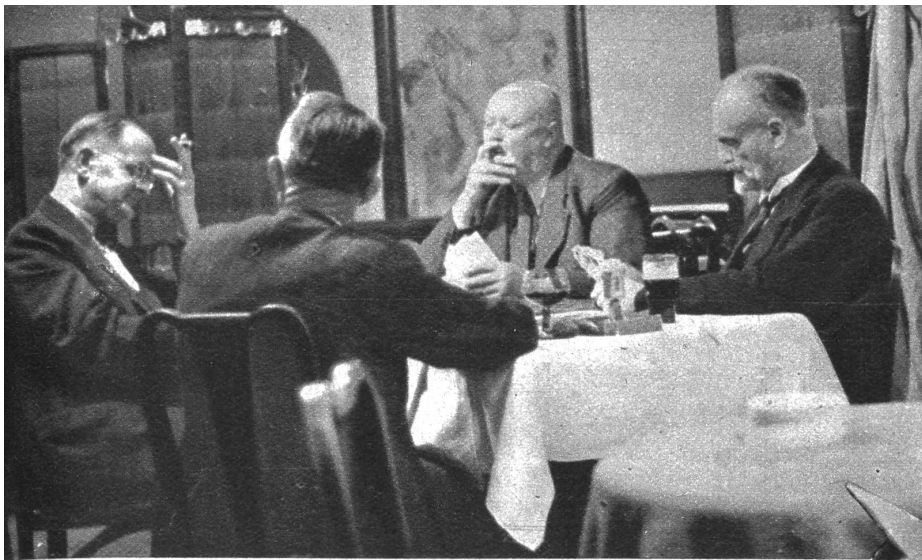
In dieser vorgerückten Nachtstunde sind fast keine Gäste mehr im Restaurant; doch unermüdlich sitzen diese vier Nationalräte hinter den Karten. Nach des Tages Last ist ihnen dieser Hock wohl zu gönnen