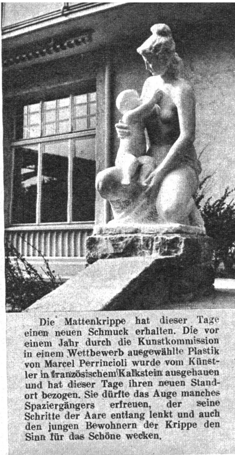
Die Mattenkrippe hat dieser Tage einen neuen Schmuck erhalten. Die vor einem Jahr durch die Kunstkommission in einem Wettbewerb ausgewählte Plastik von Marcel Perrincioli wurde vom Künstler in französischem Kalkstein ausgehauen und hat dieser Tage ihren neuen Standort bezogen. Sie dürfte das Auge manches Spaziergängers erfreuen, der seine Schritte der Aare entlang lenkt und auch den jungen Bewohnern der Krippe den Sinn für das Schöne wecken.

herbe Schneewinkelhorn gleich weichen, lindern Frauenarmen, die sich um einen eingepanzerten Krieger schlingen. Sie drangen aus der Tiefe der Staffalp in die weltferne Höhe und klangen so feierlich, weil sie heute zum ersten Male sargen und jubelten. Dem gestern abend war in die Hütte der Alp neues Leben eingezogen; mit etwa zwanzig Stück Vieh, mit seinem Sohn, dessen Weib und Kind, war der strubmähmige, alte Senn, den im vergangenen Jahr Lauener in der oberen Hütte getroffen hatte, auf die Staffalp gekommen.