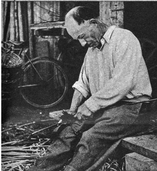
Die Weide wird fein gehobelt