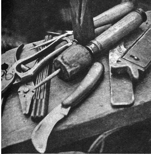
Werkzeuge des Korbers: Zangen, Schere, Hobel, scharfes Weidenmesser, Weidenspalter, Ahlen und anderes mehr