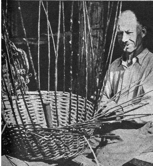
Am Korb werden die Seitenwände erstellt

Die Arbeit beginnt am Boden; man verwendet dazu starke, ungeschnittene Ruten, dann steckt man ebensolche Ruten ein für den Rumpf, und nun werden die zurechtgeschnittenen und präparierten Weiden für den Korb eingeflochten bis zur gewünschten Höhe. Zuletzt folgen der obere Rand und die Handgriffe. J. F.