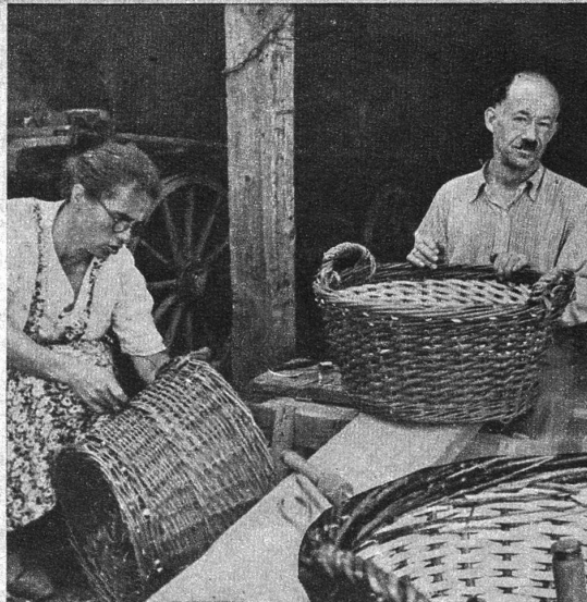
Die Frau, als tüchtige Mithelferin, hat grad einen Boden eingeflickt

Zuletzt erfolgt die Anbringung der Handhebi