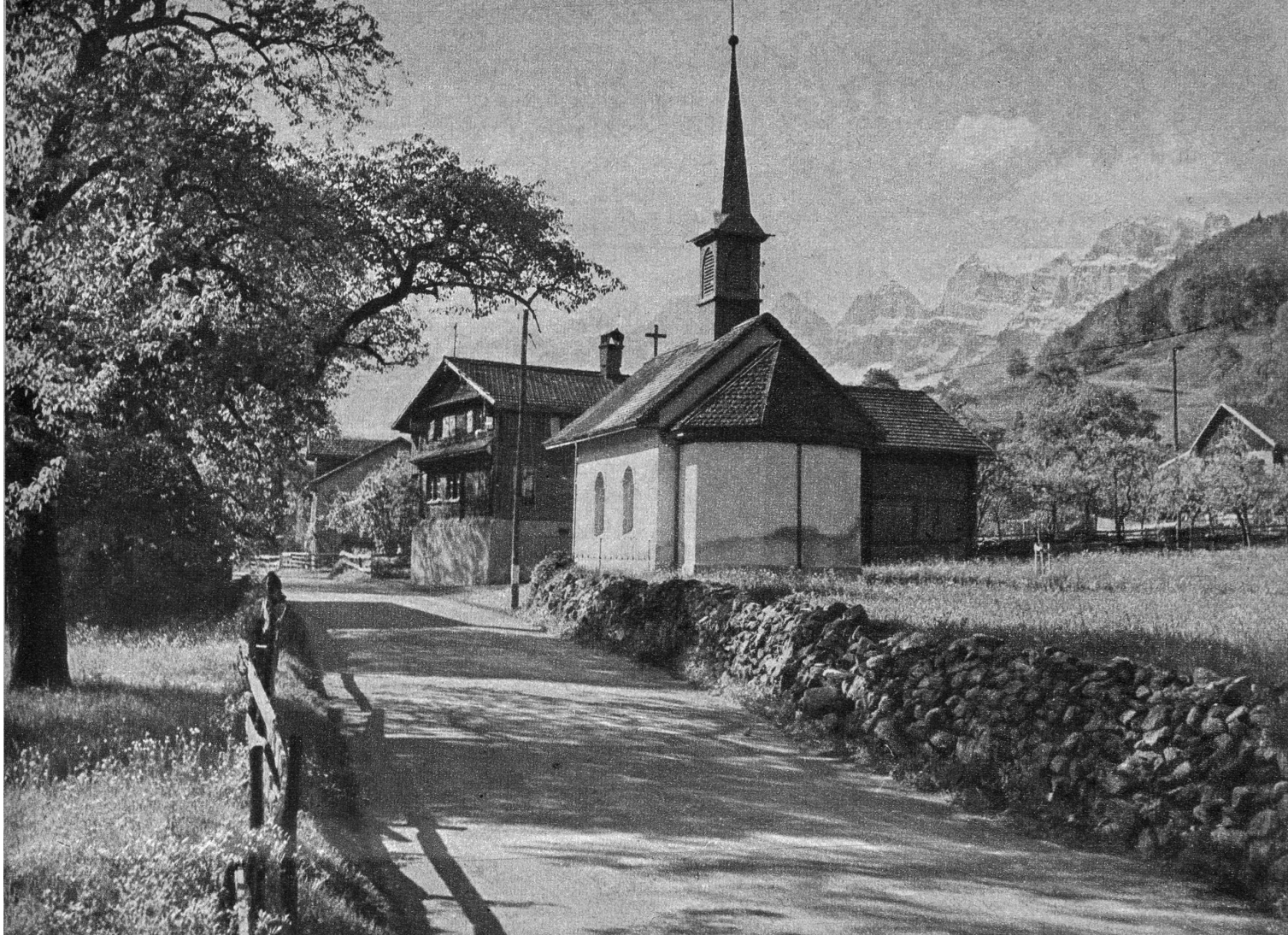
Halbmil, ein stiller Weiler an der Strasse Sargans-Wallenstadt. Im Hintergrund die Churfirnten