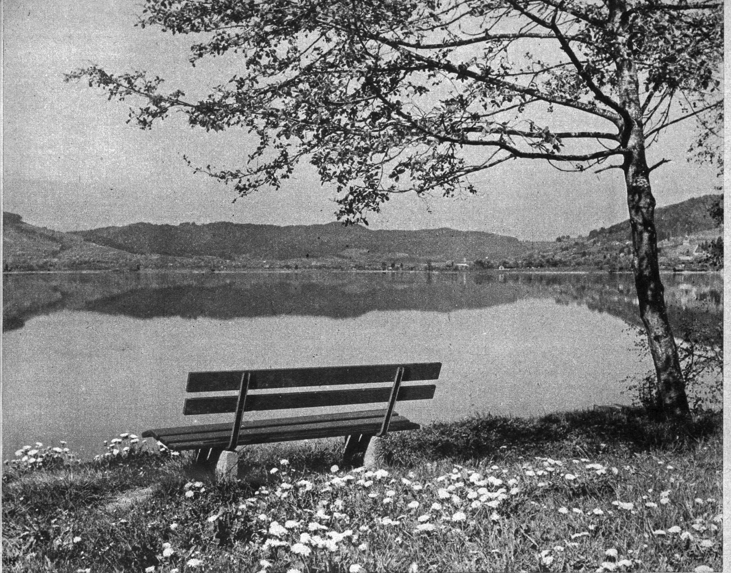
Frühling am Aegerisee