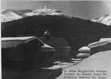
Im stillen Bergdörflein Mompertavetsch bei Disentis finden die Einwohner während den langen