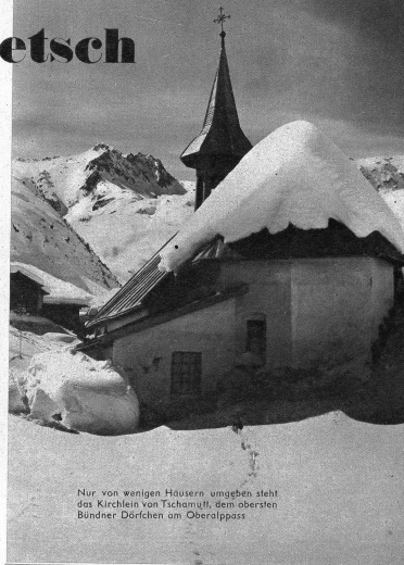
Nur von wenigen Häusern umgeben steht das Kirchlein von Tschamutt, dem obersten Bündner Dörflein am Oberalppass