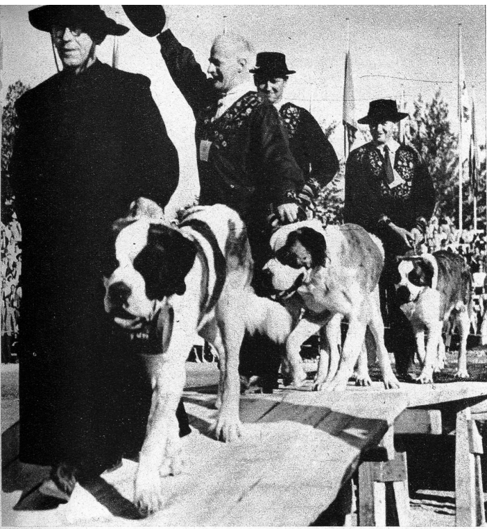
Im Rahmen der «Züka» wurde im Ausstellungsareal unter dem Patronat der Schweizerischen Kynologischen Gesellschaft eine Nationale Hundeausstellung veranstaltet, an der rund 900 Hunde, die 60 Rassen repräsentierten, vorgeführt wurden. Bei der Vorführung der schönsten Rassehundegruppen führte ein Mönch vom Grossen St. Bernhard die Gruppe der Bernhardinerhunde -Züchter an.