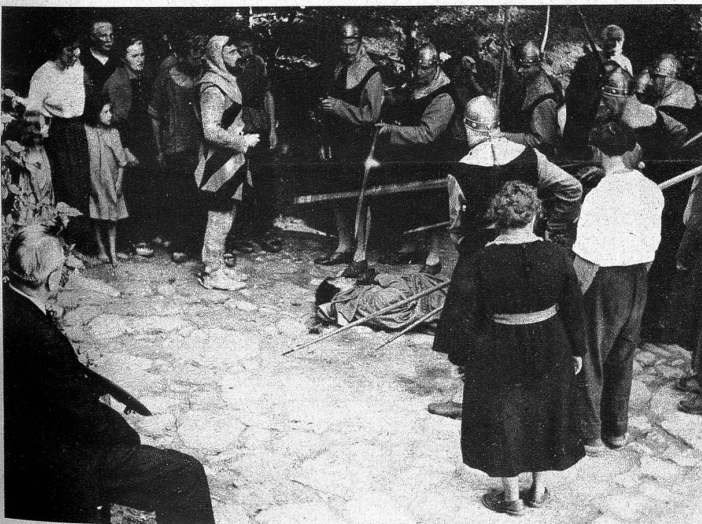
Vergangene Woche fand im Bundeshaus die alljährliche Konferenz unserer Auslandsvertreter mit Bundesrat Petitpierre statt. Zum Abschluss der Besprechungen wurde ihnen von der Tellschuss-Gesellschaft Altdorf in der Hohlen Gasse die Tellschuss-Szene vorgeführt. Unser Bild zeigt einen Ausschnitt aus dem Spiel: Landvogt Gessler, von Tells Pfeil getroffen, ist vom Pferde gesunken.

In einer Zeit fieberhafter politischer Tätigkeit schlug der Attentatsversuch auf 3 Mitglieder der tschechischen Regierung, nämlich Aussenminister Masaryk, Vizeministerpräsident Zenkl und Justizminister Drtina wie eine Bombe ein. Alle drei erhielten an sie adressierte Parfumpakete, die je 200 g TNT-Sprengstoff enthielten. Unser Bild zeigt das an Vizeministerpräsident Zenkl adressierte «Liebesgabenpaket»