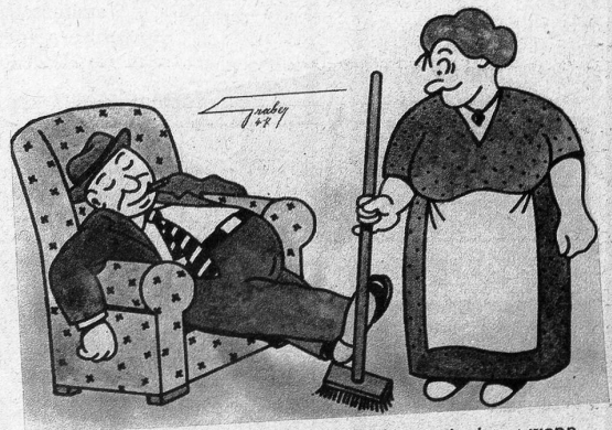
«Merkwürdig, die beste Zigarre wird verdorben, wenn man sie ausgehen lässt.» «Ja, und mit den Männern ist es auch so!»

Senkrecht: 3 etwas, das einem mundet; 4 jemanden bevorzugen; 5 von Labsal; 6 Zeitmesser; 8 unsichtbar; 9 Schwarzhaut; 11 Berg im Berner Oberland; 12 Schiff; 13 Strassen in der Stadt; 14 Fleiss; 19 dicke Schnur; 20 bekannte Oper; 22 Stacheltier; 23 zusätzlich; 24 ungebunden, literarisch; 26 Lehre der schwarzen Kunst; 27 feiner Nebel; 30 Pferdeart; 31 Liebe, fremdsprachlich; 35 Lebensmittel; 38 Fluss i. d. Schweiz; 42 sich eignen; 45 Nordpolregion; 47 vorsichtig; 48 Fluss in d. Schweiz; 49 Produkt der Bienen; 50 alter Name m., 52 selten.