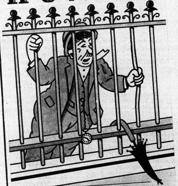
«Das ist ein Justizirrtum! Ich bin unschuldig!»