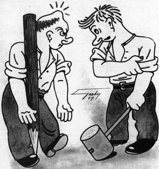
«Es het mi de no füecht!»