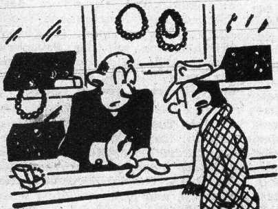
Links: «Gefällt denn der Ring Ihrem Fräulein Braut nicht?» «Oh doch – aber ich gefall' ihr nicht mehr...» (La Pese)