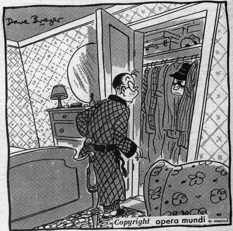
«Entschuldigen Sie, ich wusste nicht, dass jemand da drinnen ist»