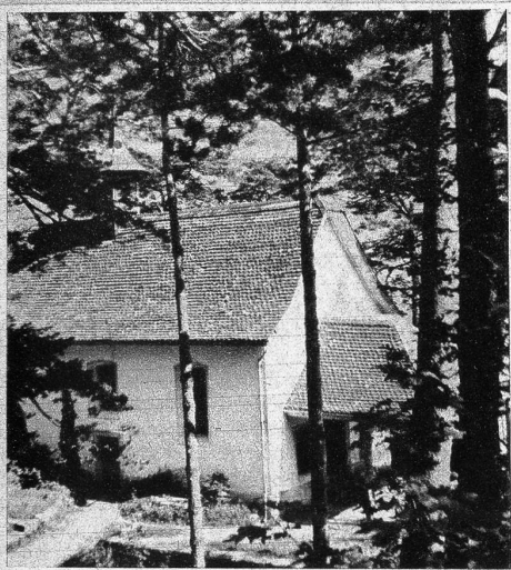
Die Kindlimord-Kapelle «Mariahilf» zwischen Gersau und Brunnen