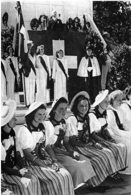
Am Montag ist das Eidgenössische Turnfest 1947 in Bern zu Ende gegangen. Es war ein glanzvoller Schluss eines glanzvollen Anlasses. Bundespräsident Philipp Etter hielt eine Ansprache, wobei er sagte: «Ihr gebt dem Lande ein dreifaches Beispiel: das Beispiel der Kraft, das Beispiel des Mutes und das Beispiel der Zusammenarbeit.» Dies war das Leitmotiv der Rede unseres höchsten Magistraten

Nr. 30 • Bern, 25. Juli 1947 • Einzelpreis 50 Rappen