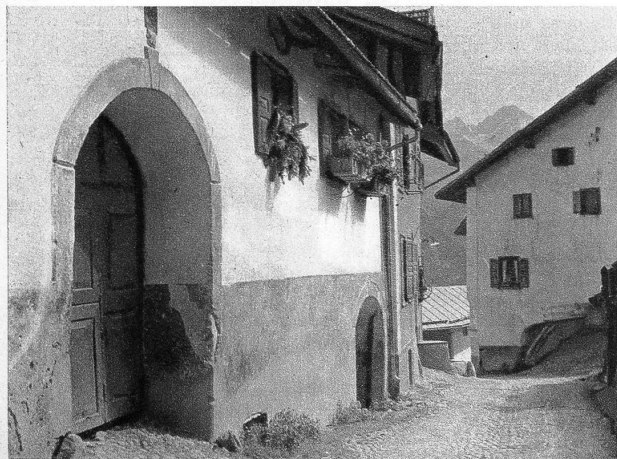
Oben: Auch in Latsch sind die Fenster der schönen, alten Häuser mit Blumen geschmückt

Wer in Chur der SBB entsteigt, um sich in die Wagen der rätschen Schmalspurbahn zu begeben, die uns in zwei Stunden ins sonnige Engadin führt, dem werden die kühnen Kehren der Albulabahn zwischen Bergün und Preda zu einem unvergesslichen Erlebnis: Aus den Fenstern erblicken und bewundern wir nicht nur ein