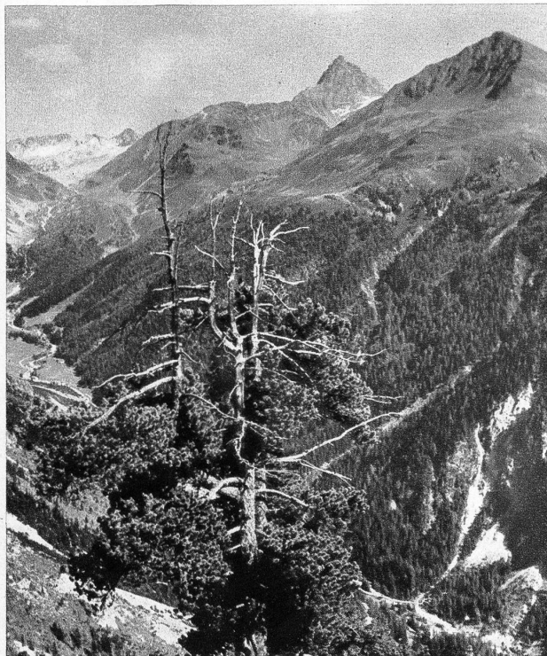
Vom Cuolm da Latsch geniesst man eine schöne Aussicht ins Val Tuors und auf den Piz Kesch