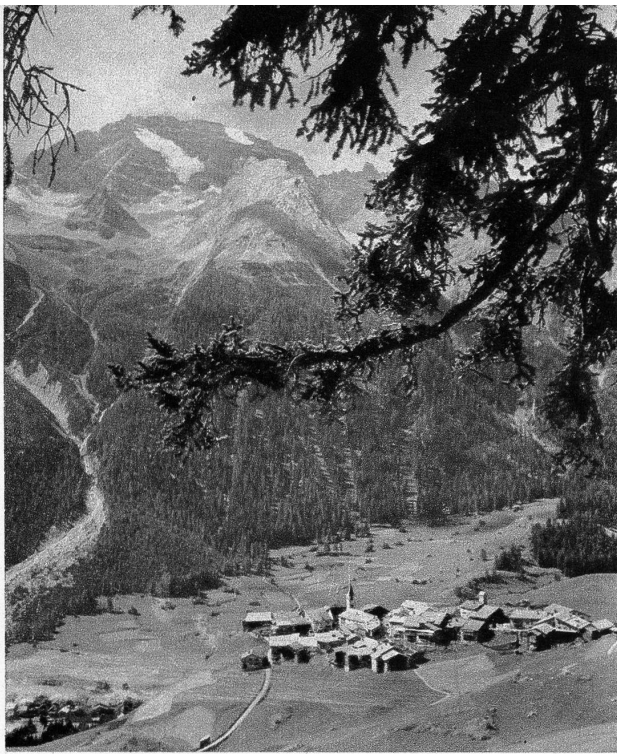
Das Bergdörfchen Latsch im Albulatal mit Piz d'Aëla