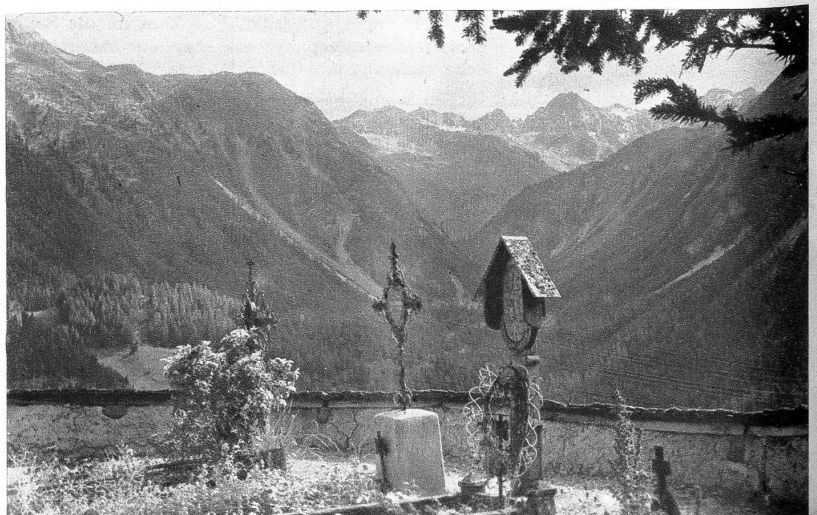
Blick vom stillen Friedhof des Bergdörfchens ins Albulatal