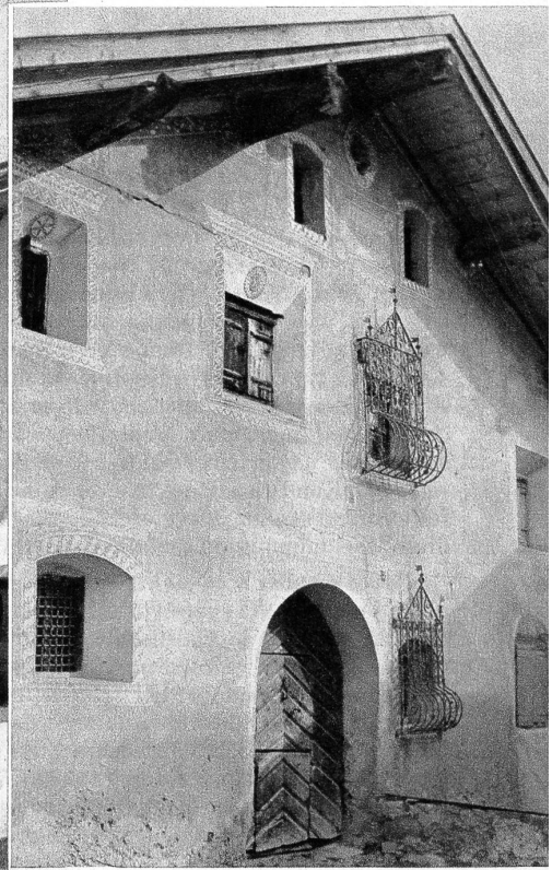
Oben: Schönes, altes Bündnerhaus in Latsch mit reich verzierten Fenstergittern Links: Am Dorfbrunnen in Latsch ob Bergün Unten: Alter Hirt aus dem Albulatal