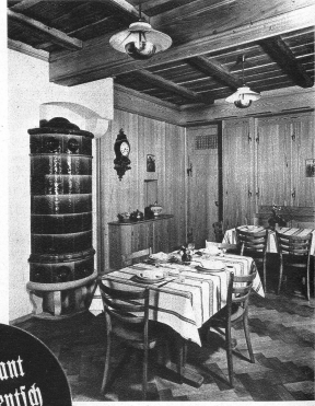
Restaurant Mühledentsch Langnau