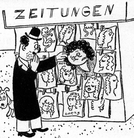
„O! Entschuldigung, ich glaubte, es sei eine Zeitung“

Senkrecht: 1 Ton. 3 Weibl. Sagengestalt (griech.). 4 Kantonsname. 5 Zahl. 6 Gewürz. 9 Süd. Oelfruchtpflanze. 11 Haustier. 14 Engl. Dogge. 15 Landenge. 16 Nachtschmetterling. 20 Scharf hell. 21 Nord. Meergott. 25 Kot des Wildes (weidm.). 26 Nordländer. 28 Ausld. Stadt. 29 Papiermass. 31 Gesetzlich.