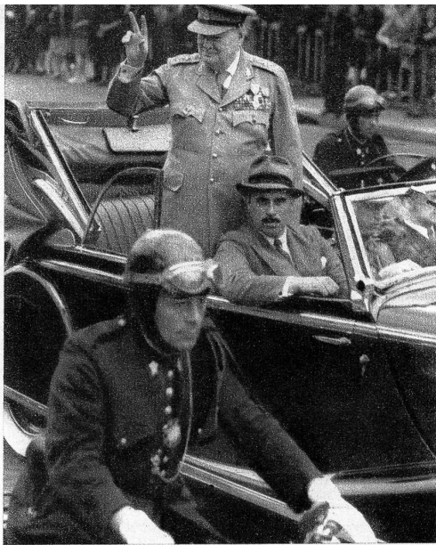
Die Pariser halten Churchill die Treue

Aber es fürchtet ihn. Und es hegt die Hoffnung, die britisch-amerikanischen Differenzen so weit zu steigern, dass die westliche «Kapitalisten-Allianz» zerbräche, noch bevor die britische Reaktion das Labour-Regime wieder aus dem Sattel geworfen. Die wichtigste britisch-amerikanische Differenz, die vor aller Augen klar liegt, ist entstanden aus dem englischen Bestreben, in Westdeutschland, vor allem in seiner eigenen Zone, die Wirtschaft in Staatshand überzuführen; die Ruhrkohle, das Transportwesen, das deutsche Finanzwesen von morgen soll womöglich unter eine ähnliche Kontrolle der Regierung gestellt werden wie in England selbst. Amerika aber widersetzt sich allen solchen Bestrebungen. Es entzieht sich den Blicken und wohl auch der Aufmerksamkeit all der eifrigen Berichterstatter, was hinter den Kulissen für fruchtlose Kämpfe um die Vorherrschaft der «liberalen» amerikanischen und die «staatssozialistischen» Organisationsmethoden ausgefochten werden. Nur das Resultat ist bisher sichtbar geworden. Die deklarierte wirtschaftliche Einheit der beiden angelsächsischen Zonen ist gleich null.