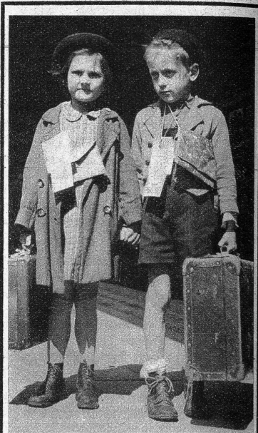
Für drei Monate dem Elend entronnen!

Das Berner Heimatschutztheater hat mit der Aufführung dieses Dreiakters bewiesen, welche grosse dramatische Gestaltungskraft im Heimatschutztheater liegt und die darstellenden Kräfte waren so echt und lebensnah, dass sie die zahlreichen Zuhörer ständig in Spannung hielten und der gestalteten Idee zu nachhaltiger Wirkung verhalfen. hkr.