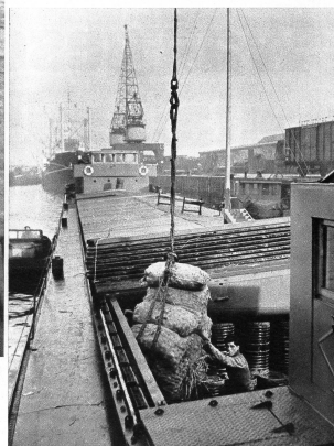
Nach langer Pause herrscht nun wieder eine freudige Betriebsamkeit um die schweizerischen Rheinschiffe, gelangt doch der grösste Teil unserer Importe auf dem Rhein zu uns. Ganze Eisenbahnzüge von Gütern verschwinden im riesigen Busch «unserer» Schiffe, die unter der Wachsamkeit der dienstfertigen «Swiss Rhine Mission» zu uns gelangen.

schluss hergestellt ist. Nach Feierabend, der übrigens an keine Stunde gebunden ist, sind unsere Leute, welche ihr Leben in einer denkbar deprimierenden Umgebung fristen müssen, meistens heiser und mit einem tausenden Schädelbrünnen belastet. Sie sind sich aber bewusst, dass sie hier auf einem für die ganze Bevölkerung der Schweiz lebenswichtigen Posten stehen und nehmen deshalb die diversen Unannehmlichkeiten mit gutem Willen auf sich. Ihr Einvernehmen mit den englischen, holländischen, belgischen und französischen Delegationen ist ausgezeichnet. Besonders hervorzuheben ist vielleicht, dass die Schweizer gerne als neutrale Beurteiler der verschiedenen Schlägen herbeigezogen und ihre Auffassungen stets mit grossem Vertrauen aufgenommen und geschätzt werden.