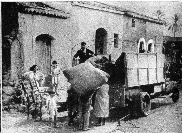
Nachdem der Vulkan seine eruptive Tätigkeit etwas eingestellt hatte, ist er dieser Tage neuerdings tätig geworden und bedroht mit seinen Lavamassen weitere Ortschaften. Unser Bild zeigt Bewohner einer Ortschaft am Aetna, die beim Herannahen der Lava ihre wenige Habe auf einem Camion retten