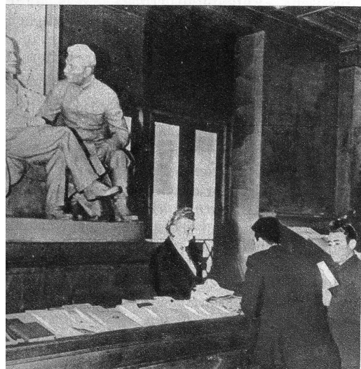
Die Buchhandlung, im Hintergrund eine Doppelplastik Lenin-Stalin

das Hotel «Moskva», beherbergt während der Aussenminister-Konferenz sämtliche Minister der teilnehmenden Staaten. Unsere Bilder zeigen: