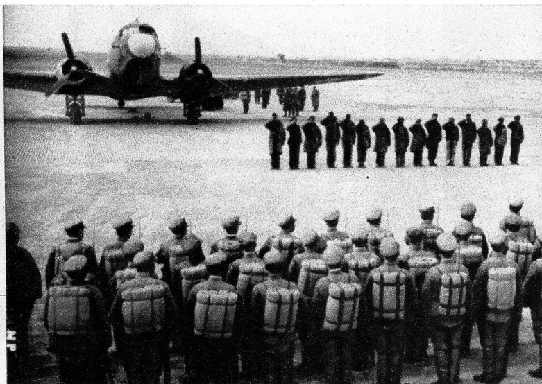
Allmählich liquidieren die Amerikaner ihre militärischen Positionen in China, was u. a. auch den Wünschen chinesischer Linkskreise entspricht. Unser Bild wurde im nördlichen Honan gemacht und zeigt einen höheren amerikanischen Stab, der sich soeben anschickt, nach Peking abzufliegen