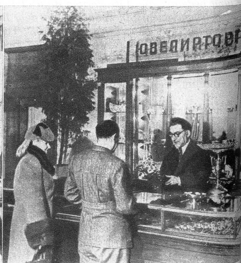
Die Bijouterie in der Hotelhalle