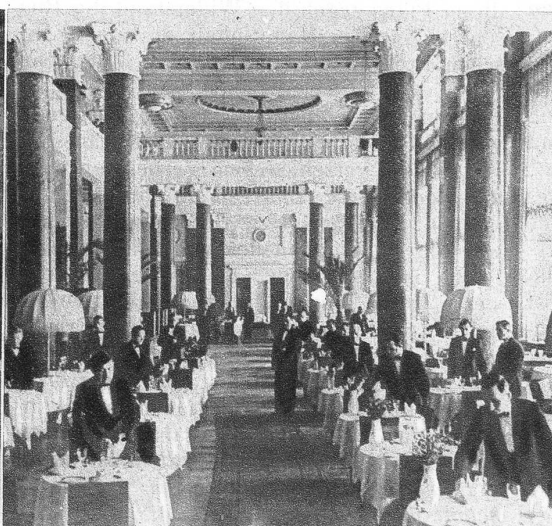
Eines der Gross-Restaurants des Hotels