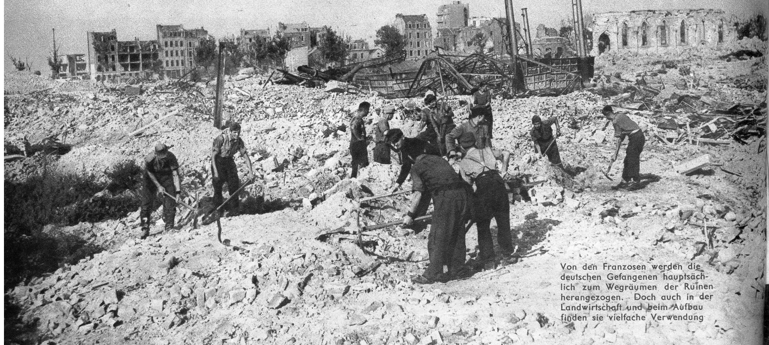
Von den Franzosen werden die deutschen Gefangenen hauptsächlich zum Wegräumen der Ruinen herangezogen. Doch auch in der Landwirtschaft und beim Aufbau finden sie vielfache Verwendung