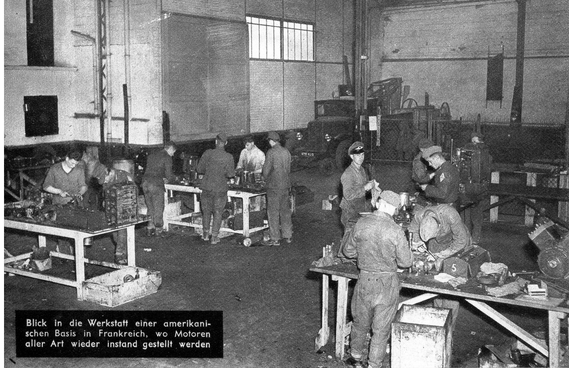
Blick in die Werkstatt einer amerikanischen Basis in Frankreich, wo Motoren aller Art wieder instand gestellt werden

zehntausende von tüchtigen, brauchbaren Männern im Kriege verloren, das Land ist teilweise noch zerstört, und wer leben will, muss auch arbeiten und aufbauen. So wurden überall die deutschen Kriegsgefangenen eingesetzt, in der Landwirtschaft, bei den staatlichen Eisenbahnen und Autowerken. Viel wurde in der Welt über die Behandlung dieser PG's geschrieben und kritisiert, denn Tatsache ist, dass sie nicht in allen Lagern unter guten Bedingungen gehalten werden. Doch darf man nie vergessen, was das französische Volk in den letzten Jahren durchgemacht hat. Wohl ist es ein grosser Fehler, Rache zu üben, denn so entsteht nie eine bessere Welt, aber auch heute noch, zwei Jahre nach Kriegsende, geht es dem Franzosen selbst noch nicht gut. Ihre Lebensmittelrationen sind zu klein, um richtig leben zu können und die Preise für alles bewegen sich fast in astronomischen Zahlen. Darum ist es kein Wunder, dass auch die deutschen Kriegsgefangenen in Frankreich unter diesen Mängeln zu leiden haben, wenigstens diejenigen, die unter französischer Kontrolle stehen. Den andern, die für die Amerikaner arbeiten müssen, ist sicherlich das bessere Los zugefallen — ihnen geht es nicht schlecht. Nicht nur einmal hörte der Schreiber dieser Zeilen von PG's sagen, dass sie lieber hier in Frankreich für die Amerikaner arbeiten, als nach Deutschland zu gehen, wo ihnen nur Hunger und Ruinen warten. Unsere Bilder zeigen deutsche Kriegsgefangene in Frankreich, die vorwiegend in amerikanischen Diensten stehen.