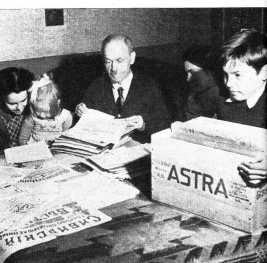
In der Stube ist die ganze Familie versammelt, um vor den Besuchern einen Teil der mühsam gesammelten Schätze auszubringen.