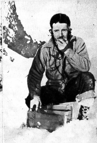
Kanadische Flieger sind abgestürzt und erfahren Hilfe: Man versuchte mit einem Flugzeug zu landen, was unmöglich war, worauf man auf dem Luftweg einen Helikopter kommen liess, diesen mit Fallschirmen niederliess, zusammensetzte und so Mann um Mann aus der Wildnis herausholte. Ein Bravourstück der technischen Hilfeleistung