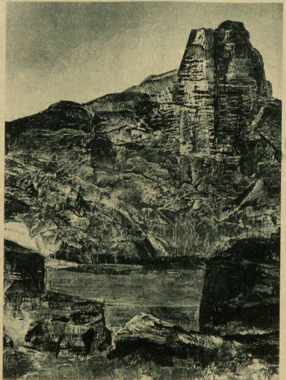
Berglandschaft. Bild links: Rohrbachstein am Rawil

Erinnerung. Die Kunstbegeisterten verehrten ihn als Schöpfer des deutschen Requiems und des Triumphliedes. Besondere Freundschaft verband ihn mit Herrn Widmann, dem Redaktor am „Bund“ in Bern. 1899 liess der Einwohnerverein Thun am Springhaus eine Marmortafel anbringen, deren Inschrift die kommenden Generationen an den genialen Meister im Reich der Töne erinnert.