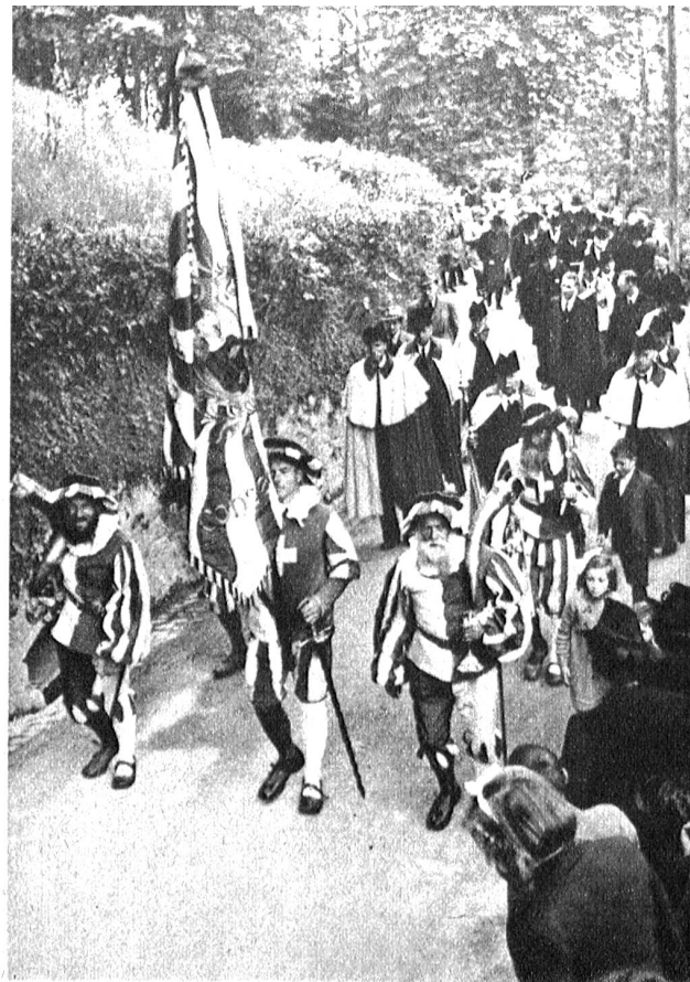
Rechts: Gut 4000 Stimmberechtigte nahmen an der Obwaldner Landsgemeinde auf dem Landenberg zu Sarnen teil. Das wichtigste Tagungsgeschäft bildete die Wahl des Ständerates Ludwig von Moos. Unser Bild zeigt den Marsch auf den Landenberg, vorab die Landsknechte in historischer Uniform