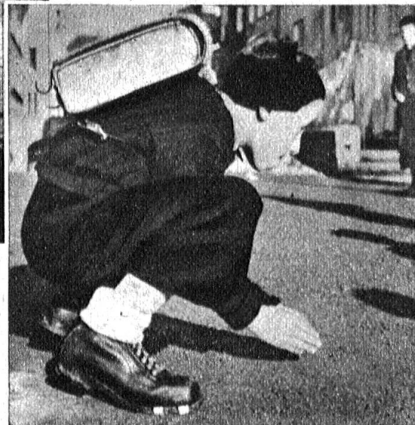
Ob er wohl trifft?