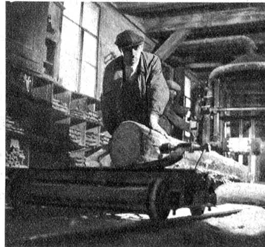
Die Verarbeitung der Stämme in der Sägerei Das Sortieren und Ablängen des Rundholzes