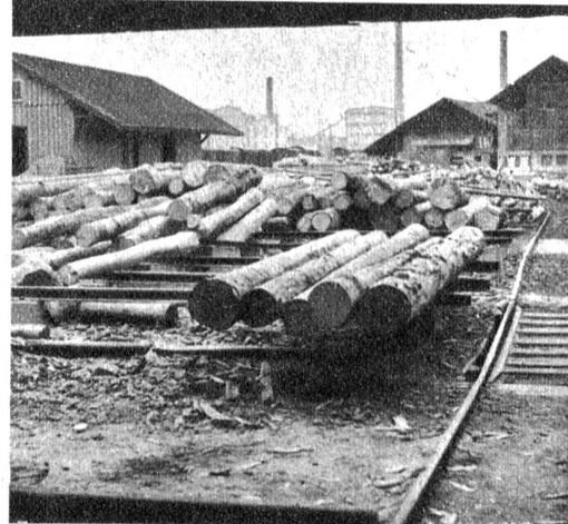
Ein Ausblick aus der Sägerei lässt die vorbereiteten Stämme im Vordergrund erkennen, die beim nächsten Gang in die Säge eingeführt werden