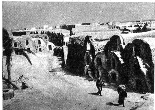
Medenine, der letzte Stützpunkt Montgomerys unmittelbar vor dem Verteidigungswerk der Marethlinie. Die Wohnstätten der Eingeborenen sind aus Lehm gebaut und bilden einen ausgezeichneten Schutz gegen die Hitze, nicht aber gegen Fliegerbomben