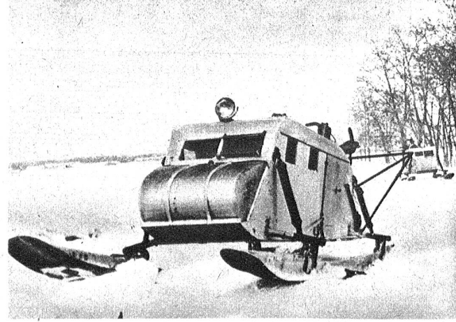
Russische Propeller-Panzerschiffen, die bei den schnellen Vorstößen im Westen von Charkow und im Raume von Orel eingesetzt wurden