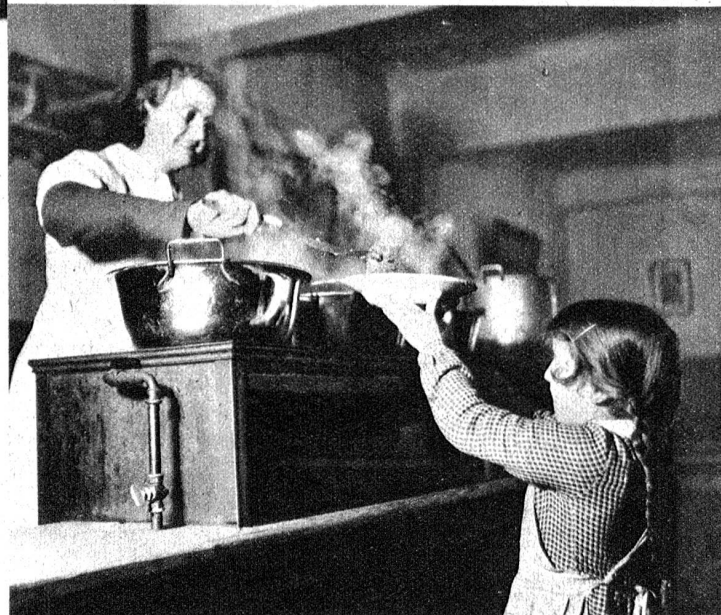
Hier wird noch einmal nachgeschöpft, wenn man von der ersten Portion noch nicht satt geworden ist