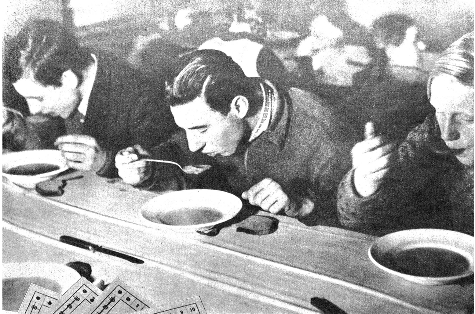
Eine warme Suppe tut in diesen kalten Tagen besonders gut und am Hunger scheint es nicht zu fehlen.