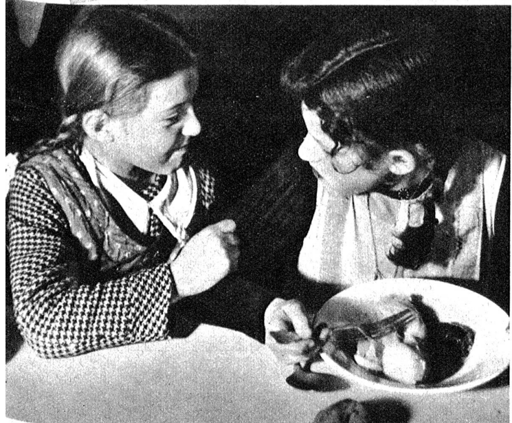
Daneben werden die letzten Neuigkeiten aus der Schule besprochen und fast ist das Essen darüber kalt geworden.