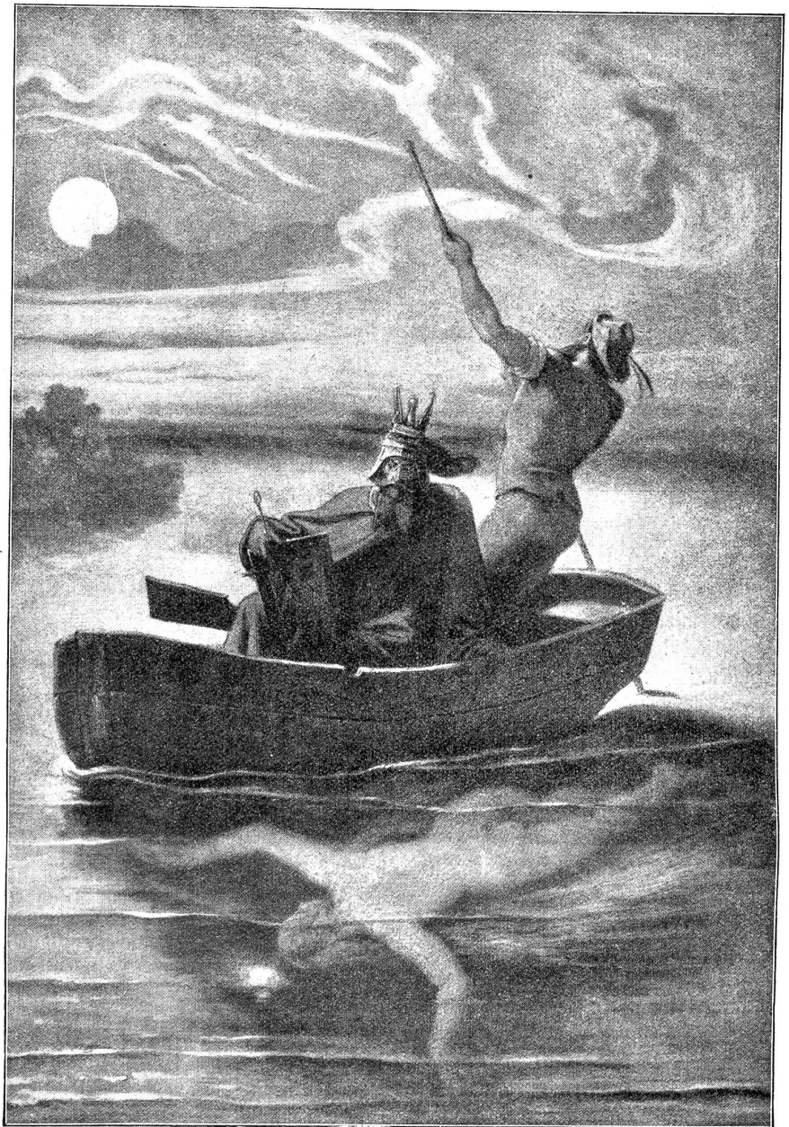
M. v. Schwind: König und Nixe.

Es ist wohl nicht zu verwundern, daß der Heier dann