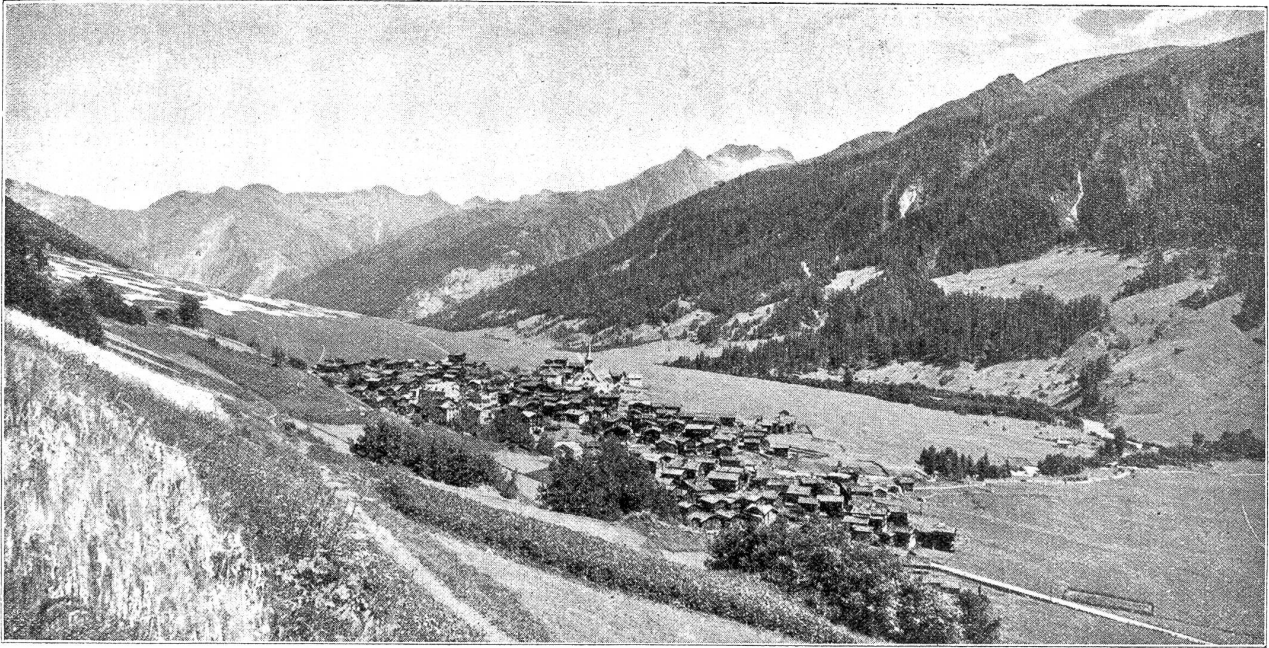
Münster im Goms, an der Bahnlinie Furka-Oberalp.