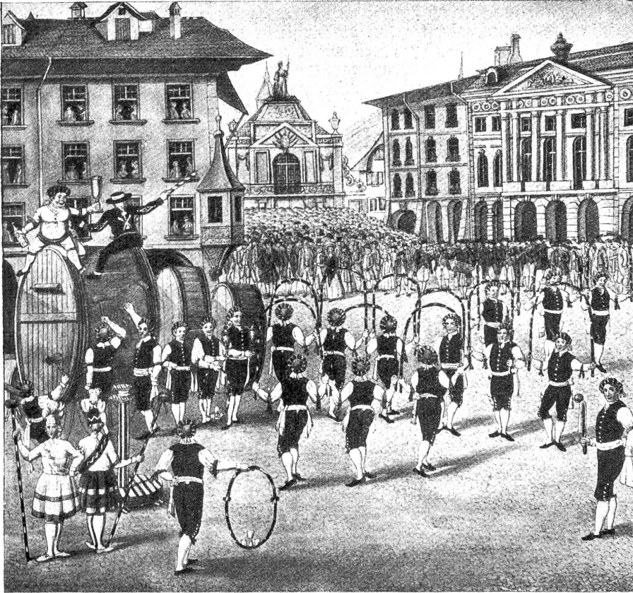
Kufertanz am Ostermontag im Alten Bern.