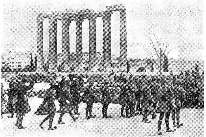
Zu den Vorgängen in Griechenland. Unser Bild zeigt den Platz vor dem Tempel des olympischen Zeus, der in ein Kriegslager verwandelt ist.

Immer noch wird gerätselt über die fremden Mächte, die hinter Venizelos stehen könnten. Es fällt den Franzosen auf, daß er sich offensichtlich gut mit Rom versteht. Aber Rom hat sich in Abyssinien enga-giert. Leute, die gezählt haben, wissen zu berichten, die bisher nach Ostafrika speidierten Truppen umfaßten mehr als hunderttausend Mann. Daß der kriegslustige Fascismus gleichsam nebenbei dem neuen Verbündeten Frankreich Feuer in sein wohlkonstruiertes Balkanbundgebäude legen würde, scheint beinahe unglaubwürdig. Und träfen die Vermutungen