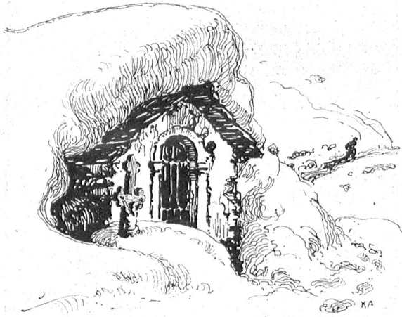
Betkapellchen im Lötschental.

Langsam senkte sich schon die Nacht zur Erde. Um das Bietschhorn spielen die letzten Sonnenstrahlen, Frieden