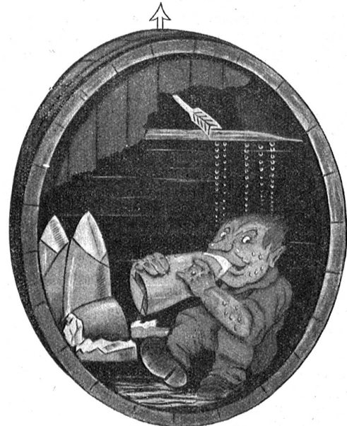
Im Gärmostfaß schickt der Hefepilz die Hälfte des Zuckergewichts als Kohlensäure in die Luft, die andere Hälfte wird zu Alkohol.

Eine wertvolle Hilfe ersteht ihm da durch die Süßmostbewegung, die in diesem Jahre auf breiter Basis organisiert ist. Süßmost nennt sich der durch leichte Sterilisation haltbar gemachte unvergorene Obstsaft. Wie er von der Preise kommt, wird der Most in geeigneten Apparaten — es gibt eine große Zahl von Systemen — auf ca. 70° C. erwärmt. Dadurch wird der Gärpilz, der bekanntlich den Zucker der Fruchtstäbe zerstört, indem er ihn in die zwei Gifte Alkohol und Kohlensäure zerlegt, abgetötet (siehe die Abbildungen) und dem Most bleibt so ein wichtiger Nährstoff, der Zucker, erhalten. Der so behandelte Most wird dann in heißgewaschene Flaschen abgezogen, verzapft und mit einem Gelatine-Küchlein über dem Zapfen verschlossen. Die gefüllten Flaschen — liegend aufbewahrt — erhalten ihren Inhalt jahre-