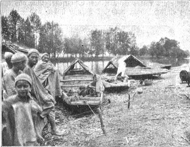
Kashmiris mit ihren Wohnbooten.

Es hat seinen Vorteil, wenn man sich nicht aussprechen kann, dann kommt es auch nicht zu hitzigen Diskussionen. Genügt hätten sie sowieso nichts; denn wie wir im nächsten