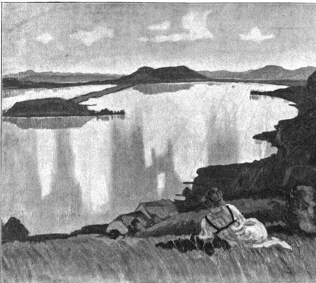
Ernst Geiger, Eigerz. — Sommertag.

Freilich erwartete Heinrich nun zu allererst auf die dringlichsten Fragen Antwort, die noch immer unausgesprochen auf seinem Gesicht geschrieben standen. Der Zeerli schien aber nicht lesen zu können, er tat wenigstens nicht dergleichen. Mit zutunlicher Anteilnahme erkundigte er sich nach dem Stand der Gewächse, nach den Aussichten für die Heuernte und nach vielen kleinen Dingen, die ihn nach Heinrichs Dafürhalten wenig angingen. Er fragte, ob die Obstbäume gut angefaßt hätten, und Heinrich berichtete der Wahrheit gemäß, man bekomme dies Jahr mit dem Obstlesen wenig zu tun. Er verfehlte nicht, mit einigem Behagen, gewissermaßen zu seiner eigenen Beruhigung, ergänzend beizufügen, daß auch in Kasparshub kaum ein Stiel geblieben sei.