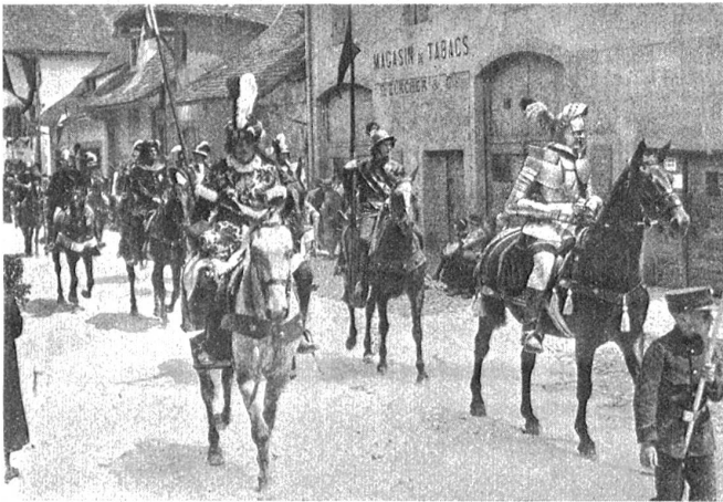
Seftzug: Adrian von Bubenberg, der Verteidiger von Murten (links); J. R. von Erlach (rechts); Knappen.