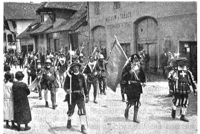
Seftzug: Gruppe der Schwyzer mit alter Burgunderfahne.

„Wenn du nach Murten gehst“, sagte meine Mutter zu mir, „vergiß die Besorgungen nicht.“