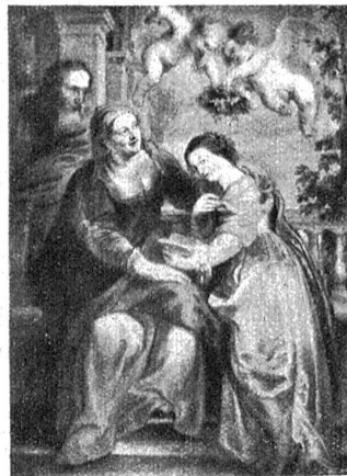
Peter Paul Rubens. — Die Erziehung der hl. Jungfrau. (Königl. Museum in Antwerpen.)