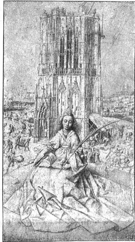
Jan van Eyck. — Die heilige Barbara. (Königl. Museum von Antwerpen.) (Das kostbarste Kunstwerk der Belgischen Ausstellung)

Diesmal sah er mit dem Wunsche, unerkannt allein zu sein und zu rasten in einer düstern Kneipe der Altstadt.