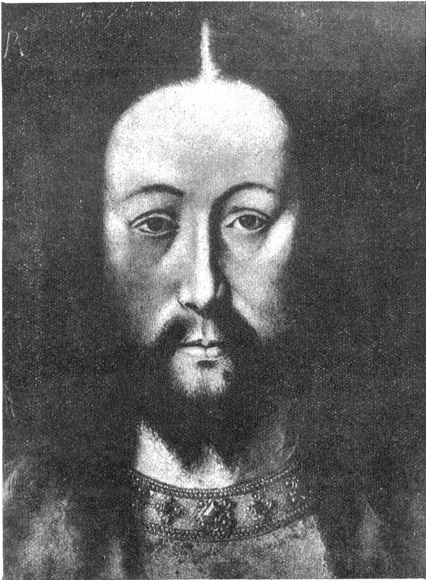
Jan van Eyck. — Christus-Kopf. (Ist im Nachlasse eines englischen Pfarrers aufgefunden worden.)