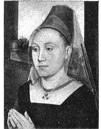
H. Memling. — Porträt der Barbara van Vlienderberg. (Kunstmuseum in Brüssel.)