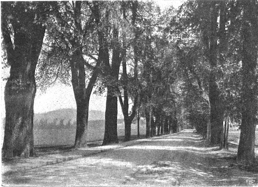
Baumallee Bolligenstraße gegen die Waldau.