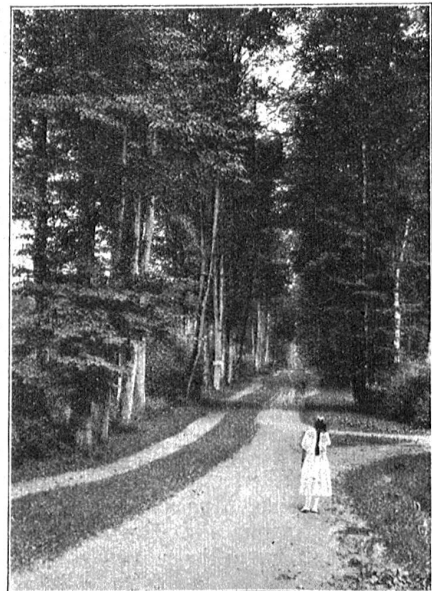
Weg im kleinen Breitgartenwald nach Reichenbad.

Wohl etwas müde von dem vielen Geschauten, aber ganz begeistert von den Herrlichkeiten der Academia delle belle Arti, der großen Gemäldesammlung, deren Glanzpunkt Raphaels heilige Cäcilia ist, vor der einst Goethe ergriffen stand, wandern wir nachmittags nochmals durch die Straßen und Plätze.