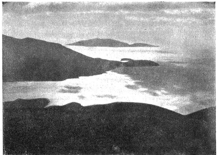
Über den griechischen Gewässern. Im Hintergrund die kahle Berginsel Ithaka, die zweite Heimat Odysseus.