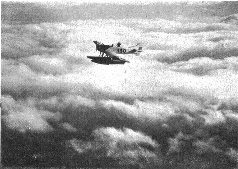
Mittelholzer und Monteur Bifegger (hinten) 3000 Meter hoch über dem Wolkenmeer beim Verlassen der Schweiz.