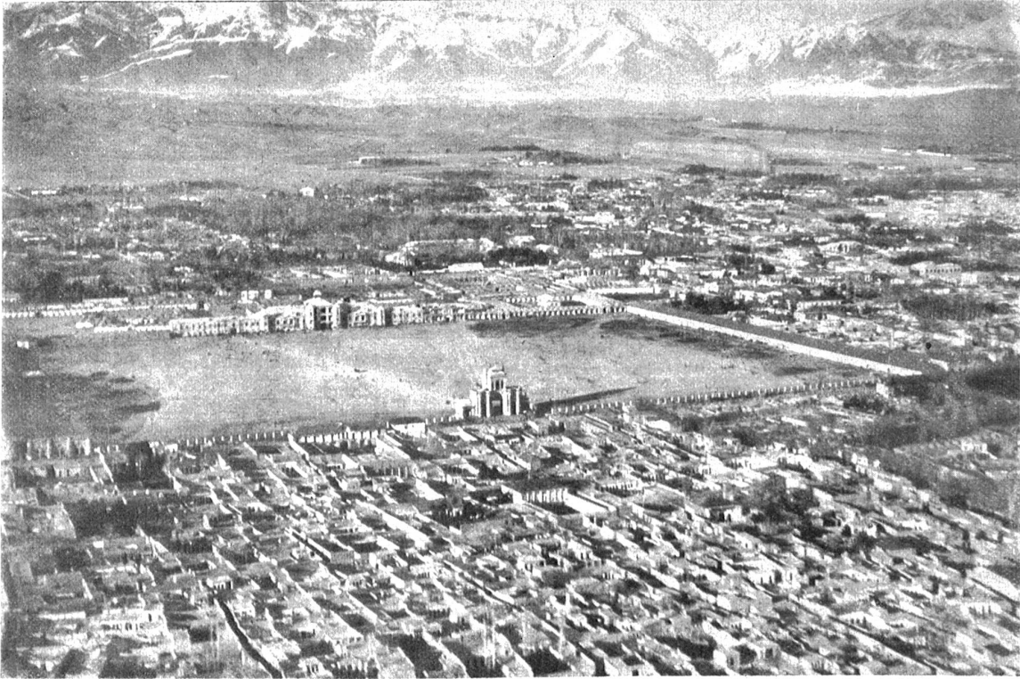
Teheran mit Schemrankette im Norden gegen das Kaspische Meer.

Im Wasserhangar am Zürichhorn wurden dem Flugzeuge in wochenlanger Arbeit die Schwimmer anmontiert und jede Fuge mit Schiffsstift wasserdicht verschlossen. Durch zahlreiche Probeflüge übte sich der Pilot auf seine Maschine ein, bis er sie wie ein Spielzeug sicher handhabte. Erst dann entschloß er sich zur Abreise, die sich auch deshalb verzögerte, weil die Türkei mit der Durchflug-Erlaubnis zögerte, und der Bundesrat keinen Finger rühren wollte, um dem unternehmungslustigen Luffteroberer die Reise zu erleichtern. Schließlich flog er ohne den hochobrigkeitlichen Segen auf gut Glück davon, und ohne die Antwort der Angoratürken abzuwarten. Er mußte dies auch, wenn er es mit seiner Fahrt nicht in die Regenzeit treffen wollte, die ihm im