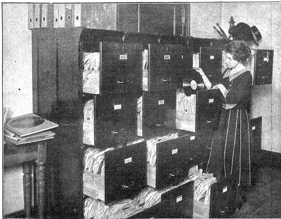
Ein Teil des Stimmemuseums an der Preussischen Staatsbibliothek. Die Lautplatten haben nach dem Gutachten erster Chemiker eine Lebensdauer von etwa 10,000 Jahren.

Es ist nicht ohne Reiz, sich auszudenken, wie ein fernes Geschlecht das Bild unserer gegenwärtigen Kultur wird überliefert erhalten. Nehmen wir an — diese Möglichkeit ist ja leider durch die Entwicklung der letzten Jahre in konkrete Nähe gerückt — Europa und damit vielleicht die ganze zivilisierte Welt werde durch ein Kriegs- und Seuchenjahrhundert verheert und junge Barbarenvölker richten einst auf den Trümmern der alten eine neue Kultur auf. Welche Schätze von Hilfsmitteln würden da der Ruinenschutt der Weltstädte, der Grund der Aecker und Weinberge, der Schlamm der Meere und Seen den Archäologen jener entlegenen Kultur bieten zur Rekonstruktion der Vergangenheit! Denken wir uns nur aus, was wir von den alten Babyloniern alles wissen könnten, wenn wir aus dem mesopotamischen Wüstensande nicht nur Tontafelbibliotheken, sondern ganze Bildergalerien und Kupferstichsammlungen, in staub- und feuchtheitsicheren Safes eingeschlossen, herausgraben könnten!