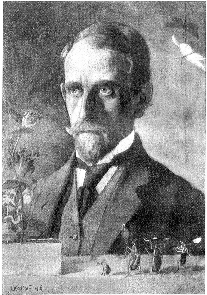
Ernst Kreidolf : Selbstbildnis.

Charlotte seufzte. „Ich weiß eben nicht, was ich wünschen soll. Wenn ich ein Mann wäre, so wüßte ich es. Ich würde in einer großen Stadt studieren, Geschichte oder Biologie oder Nationalökonomie, irgend eine Materie, die von einer Seite dem Menschen und der Menschheit beikommt; nebenbei ginge ich so viel als möglich aus, in die politischen Räte und Versammlungen, in die Armenquartiere und Zufluchts Häuser, in Theater und Lokale, wo die Großstadtgesellschaft hingehet — ich hätte reichlich ein paar Jahre zu tun, und nachher wüßte ich wahrscheinlich, wo ich mich hinstellen oder ob ich weiter lernen und sehen sollte. Vielleicht würde ich mir eine Familie gründen; vielleicht würde ich die Freiheit vorziehen, um einem Herzensberuf zu leben. Möglicherweise könnte ich diesen Plan auch als Mädchen ausführen, aber nur in sehr beschränkter Weise; und darüber eben hoffte ich, Sie befragen zu dürfen. Ich werde ja einen Bruch zu Hause riskieren müssen, und das ist