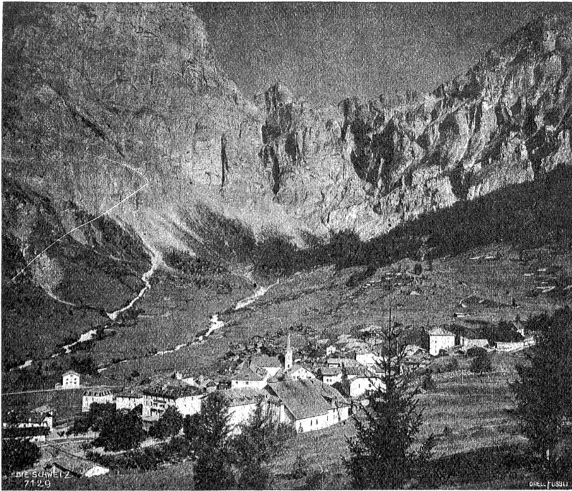
Leukerbad mit Gemmiwand.

Strophulose bei Kindern und jungen Leuten, besonders wenn sie mit Hautkrankheiten verbunden sind, finden sehr oft Heilung in Leuk. Auf Wunden und Fisteln wirken die verlängerten Bäder günstig. Dagegen bei Komplikationen der Strophulose mit Lungenschwindsucht paßt die Leukerkur nicht. Als weitere Leiden, die mit Erfolg durch Baden in den Leukerquellen bekämpft werden, seien genannt: Rheumatismus und sogenannte rheumatische Neuralgie, chronische Katarthe der Schleimhäute, gichtische Deformationen und im Gebiete der Nerventränkheiten Unempfindlichkeit, Lähmungen und Krämpfe. Diese weitreichende Heilwirkung sichert Leukerbad eine hervorragende Stelle unter den schweizerischen Termakurorten. Ein Besuch der interessanten Bäder, zu denen auch Passanten Zutritt haben, lohnt sich auch für denjenigen, der mit keinen Gebrechen irgend welcher Art behaftet ist.