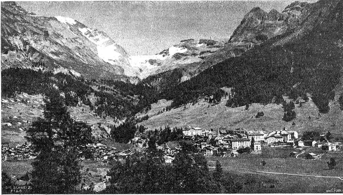
Leukerbad. — Totalansicht.