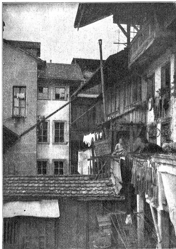
Ceilansicht von noch stehenden Häusern an der Matte, anschliessend an die abgebrochene Partie.