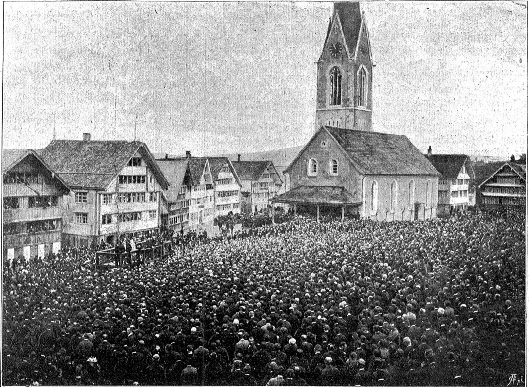
Die Appenzeller Landsgemeinde (A.-Rh.) in Hundwil.

haus zu Altdorf. Auf dem Platze vor dem Telldenkmal empfängt ihn eine militärische Ehrenkompanie mit dem Landespanner, der Musik und den beiden Harshornträgern unter dem Spiel des Fahnensmarsches. Nachdem sich auch die übrigen Mitglieder der obersten Behörden eingefunden haben auf dem Rathaus, setzt sich von da aus der Landsgemeindezug nach Böhlingen in Bewegung. Voran schreiten die beiden sogenannten „Tellen“, die, in altturnerische gelbschwarze Kriegertracht gekleidet, die mächtigen Harshörner auf den Schultern tragen. Ihnen folgt die Musik und die Ehrenwache mit dem Landespanner, unter dem Befehl eines Oberlieutenants.