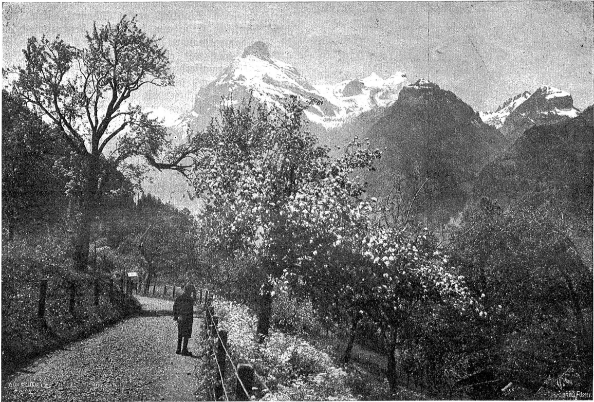
Frühling am Vierwaldstättersee.

Stephan spielte an diesem Abend auffallend schlecht und leerte dazu ein Glas Wein nach dem andern. Den Doktor brachte das Benehmen seines Partners nach und nach gänzlich aus der Laune, und er fing an, es ihm vom Standpunkt des Schachspielers wie des Nervenarztes ernstlich vorzuhalten. Stephan aber setzte allem eine mokante Gleichgültigkeit entgegen, schien an etwas anderes zu denken und sagte einfach: „Spielen Sie nur, spielen Sie nur, ich vergnüge mich auf meine Weise.“ Als Röhr unter diesen Umständen die Sitzung frühzeitig und ärgerlich abbrach, bestellte sich Stephan eine neue Flasche und blieb. Es waren nur noch wenige Menschen da, zwei Herren diesseits der Holzwand, die nur selten einmal hieherkamen, und jenseits ein Billardspieler, den man zwischen minutenlangen Zielpausen seine Stöße ausführen hörte. Als Röhr gegangen war, sah Stephan ein paar Sekunden lang durch die Glascheibe dem Billardspieler zu. Später geriet er mit den beiden Herren diesseits der Wand in eine Unterhaltung; denn er war bereits in einem Zustand, in dem man mit Leichtigkeit Bekanntschaften anknüpft. Man sprach von der Stadt, von ihren Vorzügen und Nachteilen, und Stephan äußerte, daß er vorhabe, sie bald zu verlassen. Er war höchst gesprächig und lachte häufig in einer selbstgefälligen und jovialen Weise. Er sagte, daß er durchaus nicht bedaure, aus diesem Bürgerneß wegzukommen; allerdings — „die Frauen sind hier schön, sogar sehr schön!“ schloß er.